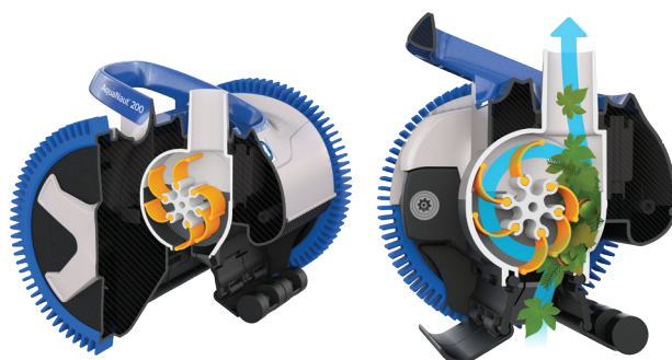
V-Flex®: Turbine mit mobilen Schaufelblättern, um große Schmutzteile einzufangen