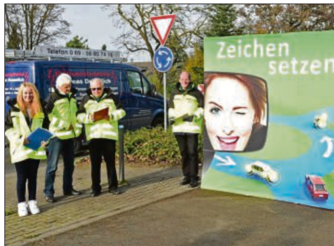
Die Verkehrszähler am Kreisel in Sprendlingen beobachten den Straßenverkehr.

Lichts, gerade jetzt in der dunklen Jahreszeit, dies betreffe aber auch Fußgänger, die möglichst dunkle Kleidung vermeiden oder solche mit Reflexionsstreifen tragen sollten. „Oft wird auch gegen die richtige Nutzung der Nebelschlussleuchte versto-