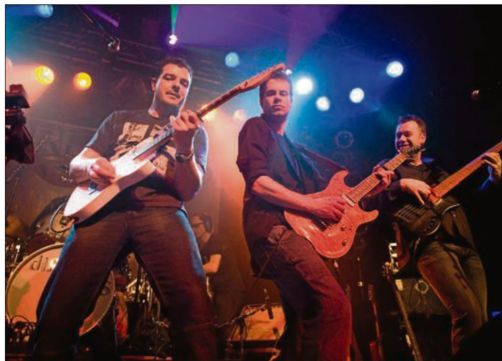
Die Dire Straits-Coverband Dire Strats gastiert am Samstag, 27. Dezember, und Sonntag, 28. Dezember, in der Kulturhalle Schanz in der Carl-Zeiss-Straße 6 in Mühlheim. Das Konzert beginnt jeweils um 20.30 Uhr, Einlass ist um 19 Uhr. Karten gibt es im Vorverkauf für 16 Euro (plus VVK-Gebühr) im Mühlheimer Buchladen an der Bahnhofstraße, im Schanz sowie online unter www.schanz-online.de. Soweit vorhanden, gibt es Karten für 18 Euro auch an der Abendkasse. Nähere Informationen gibt im Schanz unter ☎ 06108 791247.

„Als ich 1997 zum Kreishandwerksmeister gewählt wurde, wollte ich das eigentlich nur drei Amtsperioden machen“, sagt der 60-Jährige. „Zu den nächsten Neuwahlen will ich noch einmal kandidieren, dann soll ein Jüngerer ran.“ Auch seine fastnachtliche Aktivitäten will der frischgebackene 60-Jährige künftig einschränken. „Wir haben für die Kappenabende ein gutes Team mit einigen engagierten jungen Leuten dabei“, so der Dietesheimer. „Ich denke, dass sich aus deren Reihen in absehbarer Zeit ein Nachfolger für mich als Sitzungspräsident finden lässt.“