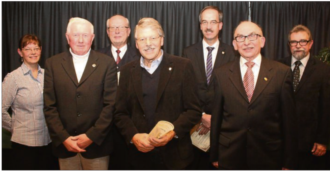
Treue Mitglieder ehrten der Sängerkreis Offenbach und die Sängerlust Hausen bei der Jahresabschlussfeier des Vereins, die im Kleinkunstsaal des Hausener Bürgerhauses an der Tempelhofer Straße stattfand.

Die Männer wirkten beim Frühlingskonzert des Sängerkranzes Nieder-Roden und beim Volkstrauertag auf dem Hausener Friedhof mit, brachten Ehejubilaren und Geburtstagskindern aus den eigenen Reihen Ständchen. Der Chor '84 holte beim Hessischen Chorfestival den Klassengewinn mit Golddiplom sowie weitere Titel und Preise. Er nahm an Veranstaltungen in Alezenu, Isenburg-Zentrum und in der Waldkirche teil, feierte