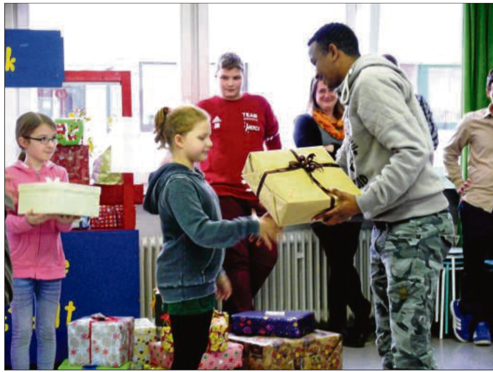
Ein persönliches Weihnachtsgeschenk erhielt jeder der in Mainhausen lebenden Flüchtlinge von den Schülerinnen und Schülern der Freien Schule Seligenstadt-Mainhausen. Rege Kommunikation gab es nach der Geschenkübergabe zwischen Schülern und Gästen, auch Fahrräder wurden abschließend noch überreicht. Mehr auf www.freie-schule-seligenstadt.de . beko