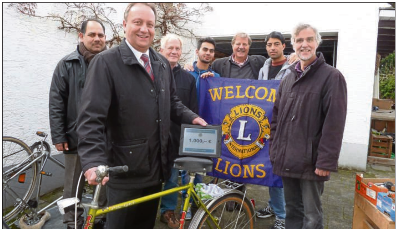
Mit den 1000 Euro vom Lions Club Rodgau-Rödermark können die ehrenamtlichen Helfer viele Fahrräder aufarbeiten und sie Flüchtlingen zur Verfügung stellen.