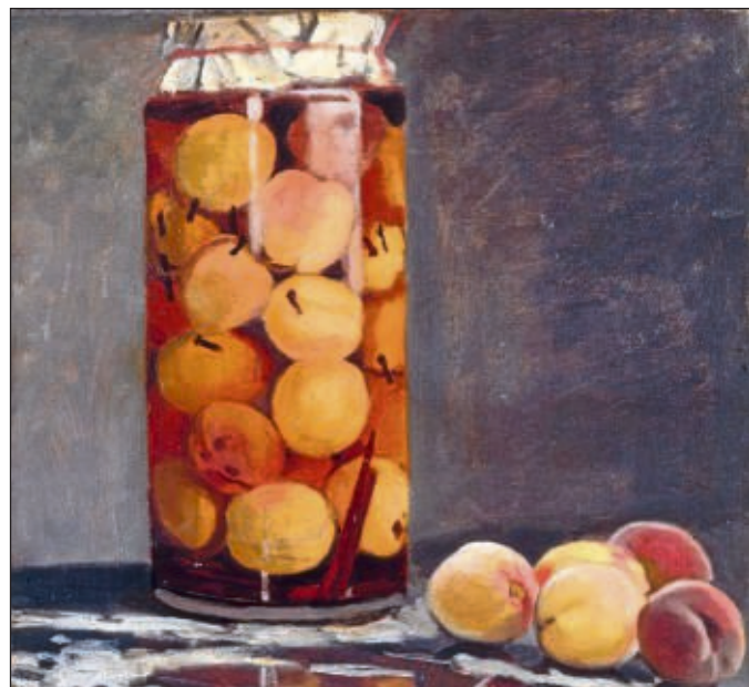
Monet: „Pfirsichglas“ (ca. 1866, Öl auf Leinwand).

Überblicksführungen durch die Ausstellung gibt es jeweils am Dienstag und Samstag, 15 Uhr, am Mittwoch und Sonntag, 11 Uhr, Donnerstag, 19 Uhr sowie Freitag, 17 Uhr. Tickets kosten fünf Euro zuzüglich des Eintrittspreises.