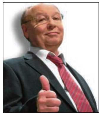
Gernot Hassknecht kennt sich mit Cholerikern aus.

Langen (red) – Die Fans kennen und lieben Gernot Hassknecht als cholerischen Kommentator. Für viele ist er die Stimme der ungehörten Masse. Mit dem Bühnenprogramm „Das Hassknecht Prinzip – In zwölf Schritten zum Choleriker“ bekommen die Besucher endlich universell einsetzbare Tipps und Geschichten aus dem prallen Leben – von der Politik bis zu den großen und kleinen Themen, die alle aus dem Alltag kennen. Denn: Ein Tag ohne Ausraster ist ein verlorener Tag. Auf die Bühne tritt der Kabarettist am Sonntag, 18. Januar, um 20 Uhr in der Stadthalle Langen. Er ist das Sprachrohr, wenn es