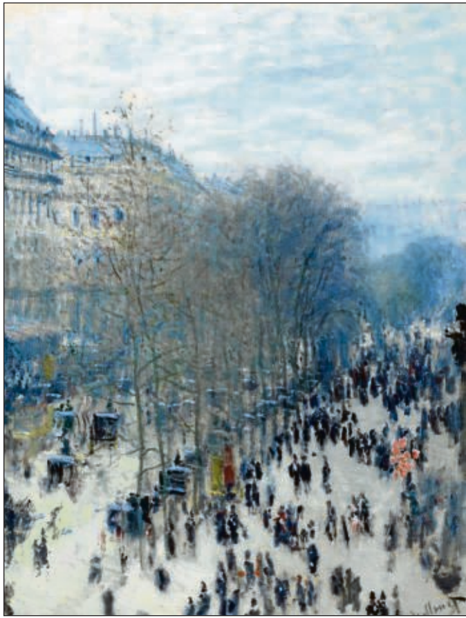
Zu sehen ist auch Monets Werk „Der Boulevard des Capucines“ (1873-1874, Öl auf Leinwand).

Ausgehend von Claude Monets Gemälde „Das Mittagessen“ (1868/69), mit dem das Städel Museum über ein Schlüsselwerk des frühen Impressionismus verfügt, und dem höchst qualitätsvollen Sammlungsbestand früher impressionistischer Arbeiten von Auguste Renoir (1841-1919), Édouard Manet (1832-1883), Edgar Degas, Alfred Sisley (1839-1899) und Paul Cézanne (1839-1906), nimmt das Städel in der Ausstellung vor allem die Anfänge der impressionistischen Bewegung in den frühen 1860er-Jahren bis hin zum Jahr 1880 in den Blick. Dabei steht die Frage im Mittelpunkt, inwiefern sich in der Malerei der Impressionisten eine zeitgenössische Seherfahrung manifestiert und wie sich die bildliche Umsetzung dieses „modernen Blicks“ im Verlauf dieser Epoche verändert. Die Präsentation zeigt neben impressio-