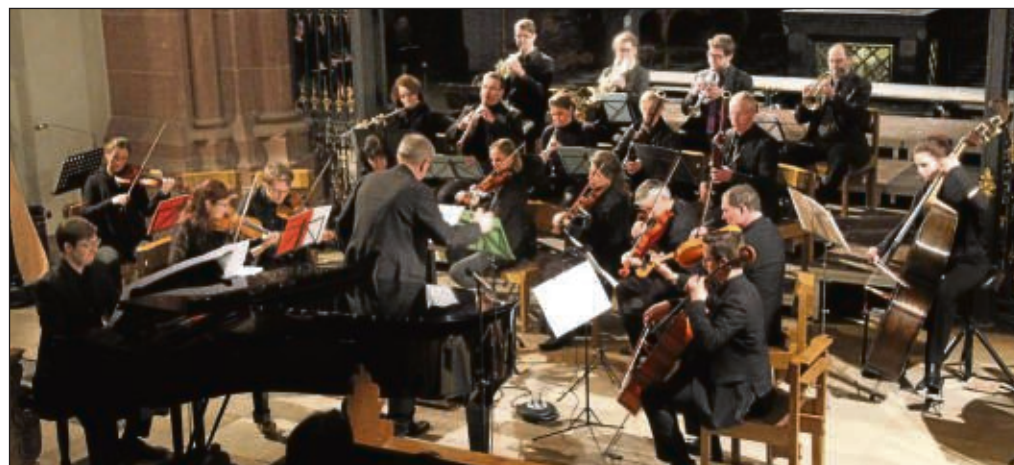
Seligenstädter Klosterkonzert (Magnificat von John Rutter und „Krönungskonzert“ von Mozart) war am Sonntag in der Einhardbasilika.

tag und Freitag sind besonders Schulklassen sowie Gruppen aus Kindertagesstätten, Gemeinden, Vereinen und Betreuungseinrichtungen eingeladen, Neuerscheinungen und Spiele-Klassiker zu testen. Wie für alle Besucherinnen und Besucher wird das Angebot der für die jeweilige Altersgruppe passenden Spiele vorgestellt und Hilfestellung bei der Auswahl angeboten. Beim Ausprobieren neuer Spiele stehen erfahrene Spielerklärerinnen und -erklärer zur Seite, die über die erste Hürde – das Studium der Spielregeln - hinweghelfen. Für einen Besuch der Spieletage sollten mindestens 90 Minuten eingeplant werden – bei Schulklassen also zwei Schulstunden. Damit Spieltische reserviert werden können, werden Gruppen um eine vorherige Anmeldung beim Kinder- und Jugendbüro der Stadt Seligenstadt gebeten (Telefon 06182-87168, Mail: jugendtreff@seligenstadt.de ). Diese Anmeldungen sind ab jetzt möglich - auch unter www.spieligenstadt.de.vu , wo außerdem nähere Informationen und der aktuelle Stand der Vorbereitungen zu finden sind.