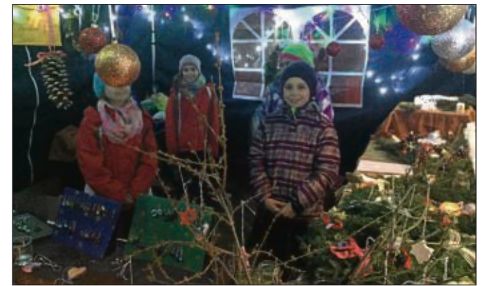
Die Klasse 4b der Käthe-Paulus-Schule hat gemeinsam mit ihrer Klassenlehrerin selbstgebastelten Weihnachtsschmuck auf dem Zellhäuser Weihnachtsmarkt zum Verkauf angeboten. Hierbei wurde die erfolgreiche Initiative des vergangenen Jahres fortgesetzt - den Erlös aus der Aktion spenden die Kinder an ein Waisenhaus in Nigeria.

>>> Die nächste SHB-Ausgabe erscheint zwischen den Jahren. Redaktionsschluss für die Ausgabe vom 7. Januar ist dann am Freitag, 2. Januar, 10 Uhr.