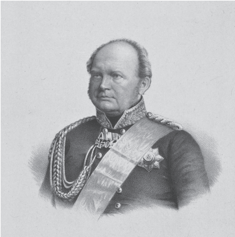
Abb. 1: Friedrich Wilhelm IV., ca. 1855, Lithographie von F. Schwabe