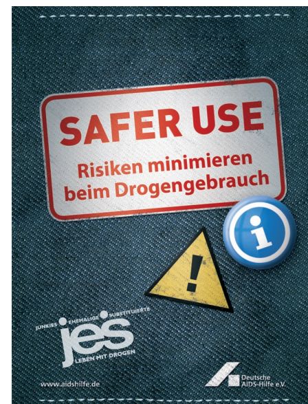
SAFER USE-Broschüre in Zusammenarbeit mit der Deutschen AIDS-Hilfe

Mit der Gründung von immer mehr JES-Gruppen und Junkiebünden im gesamten Bundesgebiet kam die Funktion der JES-Gruppen als soziales Netzwerk in ihren Regionen immer stärker zum Tragen. In JES-Gruppen finden sich Menschen, die gleiche Erfahrungen gesammelt und ähnliche Schicksale erlebt haben. Deshalb ist JES die Gruppe als soziale Gemeinschaft wichtig, in der sich der/die Einzelne ver-