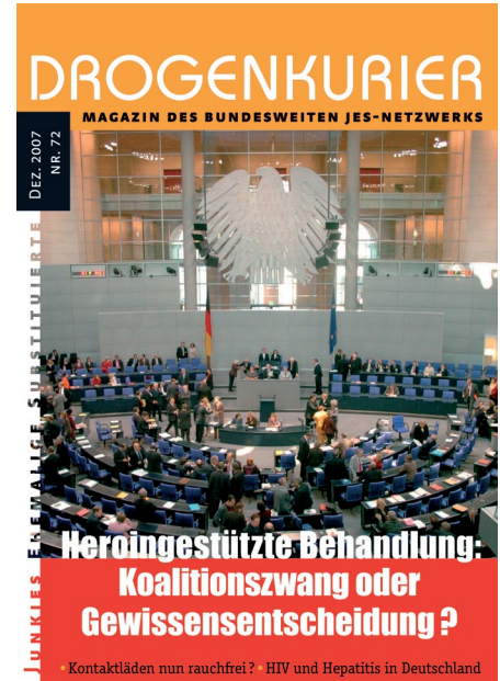
Das Magazin des JES-Netzwerks: DROGENKURIER

Bei allem Engagement der einzelnen Mitglieder wäre es nicht korrekt, die Arbeit von JES als ein kontinuierlich wachsendes bundesweites Netzwerk zu beschreiben. Vielmehr hat das Netzwerk in den letzten Jahren Wachstumssprünge, Phasen rasanter Entwicklung und Stabilisierung genauso erlebt wie Stagnation, Brüche und Instabilität. Das ansonsten in der Gesellschaft angestrebte Prinzip „weiter, höher, schneller“ trifft für die Entwicklung des bundesweiten JES-Netzwerks nicht zu. Dies hat sehr unterschiedliche Gründe, die