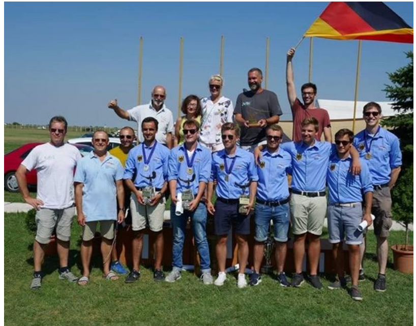
Das weltmeisterliche Team