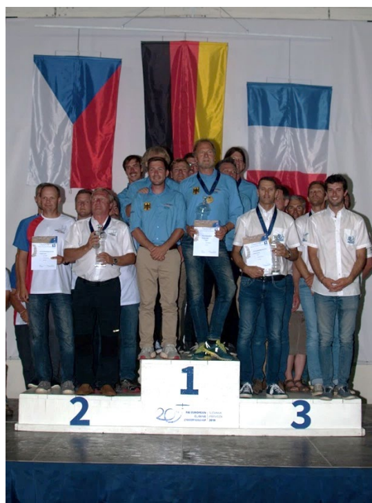
Team-Europameister vor Tschechien und Frankreich – Herzlichen Glückwunsch