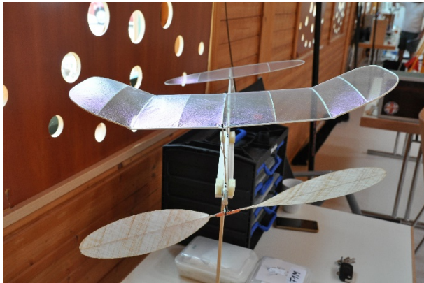
Das F1M Modell von Klaus Fröba