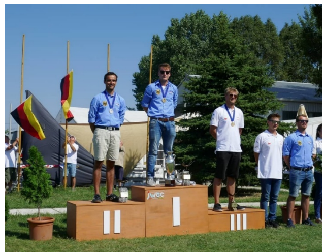
Siegerehrung in Szeged, Foto: Karsten Leucker