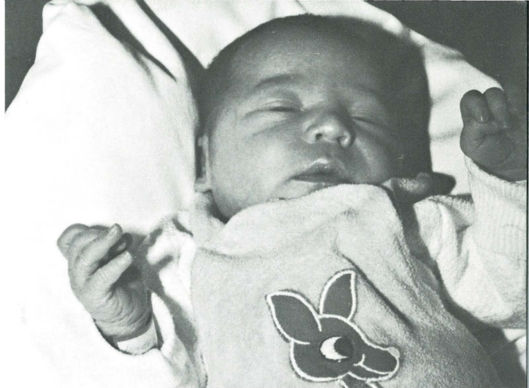
Mütterberatung: Näheres zur Pflege und Ernährung des Kleinkindes