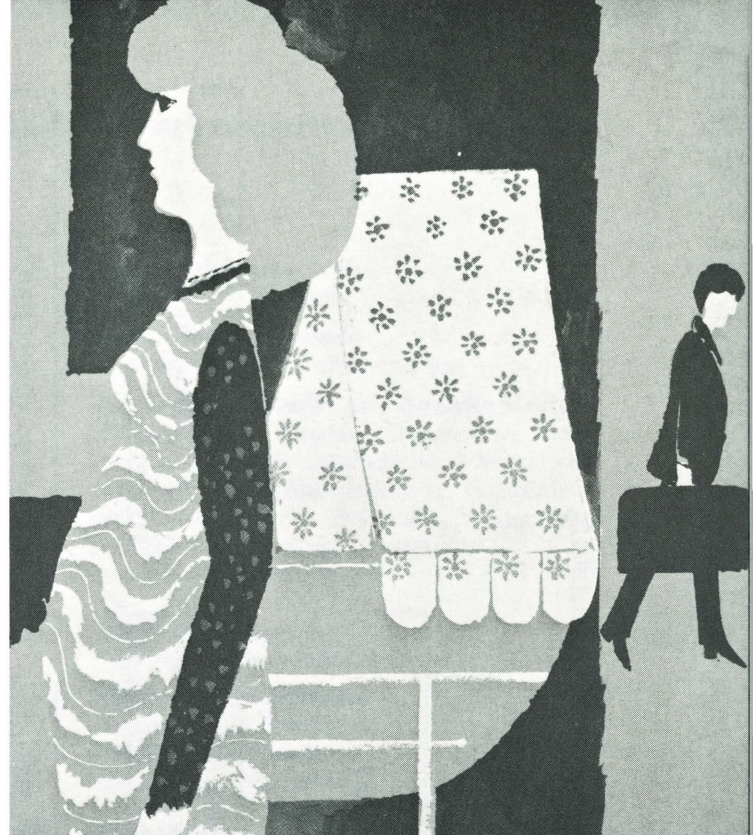
Pflegekinderaufsicht und Vaterschaftsregelungen: fürsorgische Aufgaben des Jugendsekretariates Meilen