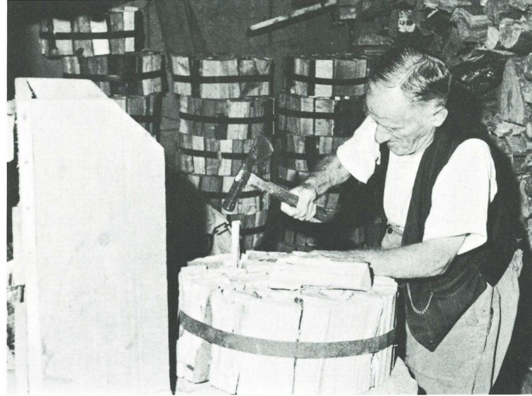
Landwirtschaftsbetrieb des Bürgerheimes Brunisberg: tatkräftige Mitarbeit einzelner Pensionäre