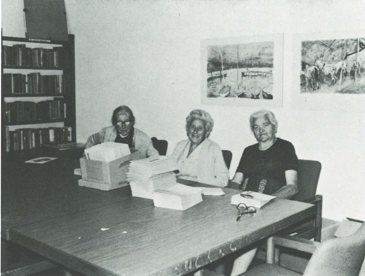
Nach getaner Arbeit: Das Dreierteam, welches das Einpacken der Ährenpost besorgt