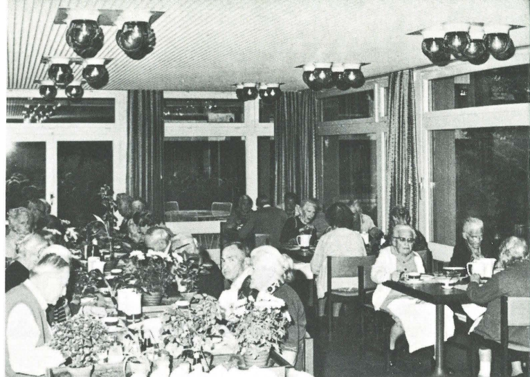
Eine gute Küche und eine lockere Atmosphäre fördern das Wohlbefinden der Betagten