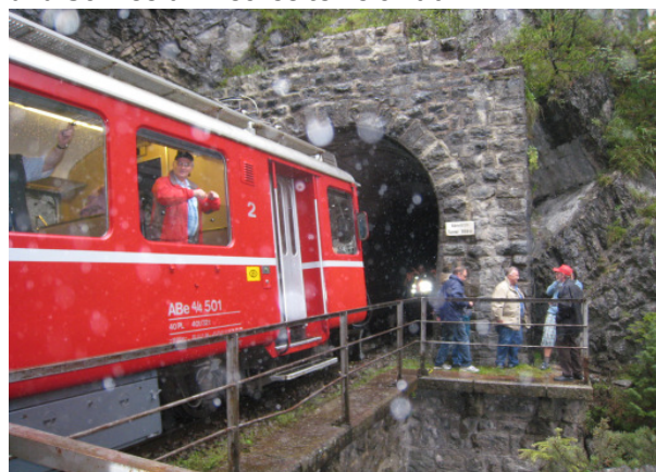
Sagenbachbrücke, unteres Portal Wiesener I-Tunnel

Ende August 2011 war eine Delegation aller Vereine von historic-RhB bei IGZL zu Besuch. Mit dem Nostalgie-Triebwagen Nr. 501 „Fliegender Rätier“ befuhr man die Strecke von Filisur bis Davos mit diversen Fotohalten. Unter kundiger Führung konnten wir die neue Antriebsanlage der Parsennbahn in der Station Höhenweg besichtigen. Leider zeigte sich das Wetter eher von der trüben Seite, Regen und Schneefall wechselten sich ab.