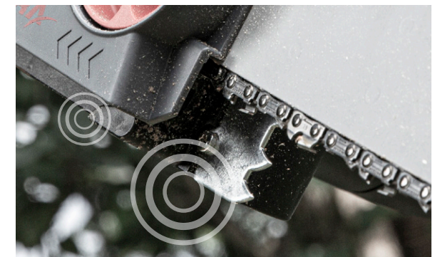
Kettenfangbolzen (l.) und Krallenanschlag