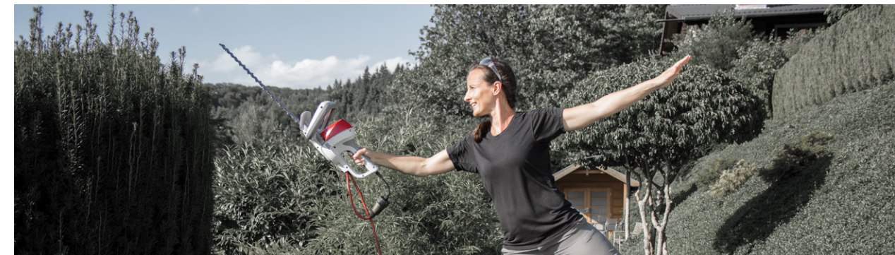
DIE ULTRALIGHT HECKENSCHERE DIE LEICHTESTE WELTWEIT MIT 2-HAND-SICHERHEITSSCHALTER MADE IN GERMANY