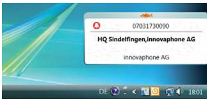
innovaphone Operator minimiert: Kommt ein Ruf herein, öffnet sich automatisch ein Fenster

konzept (auch von autark administrierten PBXen in offenen Rufnummernplänen).