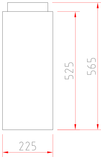
Frontansicht M 1:10