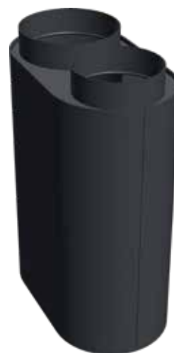
NHK S 50

Die Effektivität eines Kaminsystems hängt stark von der gesamten Konstruktion ab. Ein Nachheizkasten fördert die Effektivität und sorgt für wohliges Klima, auch bei abklingender Flamme.