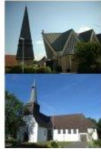
St. Maria St. Martin