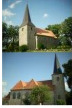
St. Peter und Paul St. Vitus