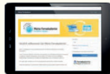
Persönlicher Zugang zum Online-Lern-Portal „Meine Fernakademie“

Nach der Anmeldung erhalten Sie von uns Ihr persönliches Lehrgangsmaterial nach Hause geliefert. Die Prüfungsaufgaben zu den einzelnen Lehrheften bearbeiten Sie bequem von zu Hause aus mit Ihrem persönlichen Zugang zum Online-Campus der Fernakademie www.meine-fernakademie.de . Innerhalb von 14 Tagen werden Ihre Aufgaben bewertet und mit wertvollen Hinweisen für den weiteren Studienverlauf versehen. Diese Ergebnisse erhalten Sie per E-Mail. Nach erfolgreichem Abschluss erhalten Sie Ihr offizielles Zertifikat per Post.