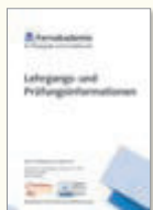
Lehrgangs- und Prüfungsinformation