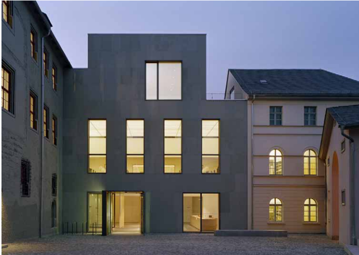
Das Studienzentrum bietet den Leserinnen und Lesern 130 Arbeitsplätze

Was haben die Wohnhäuser von Goethe und Schiller, das Stadtschloss, das Haus »Hohe Pappeln« und die Parkanlage Schloss Belvedere gemeinsam? Sie alle gehören zur Klassik Stiftung Weimar wie auch die Herzogin Anna Amalia Bibliothek.