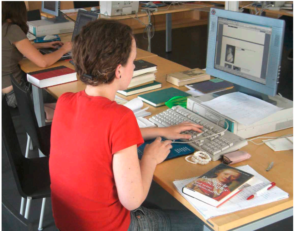
... und auch am PC gearbeitet

Bibliotheken statt. Dabei wurde dort im März von den Weimarer Schülern besonders zu Emilia Galotti gearbeitet und die Schüler aus Wolfenbüttel beschäftigten sich hier im November näher mit Faust.