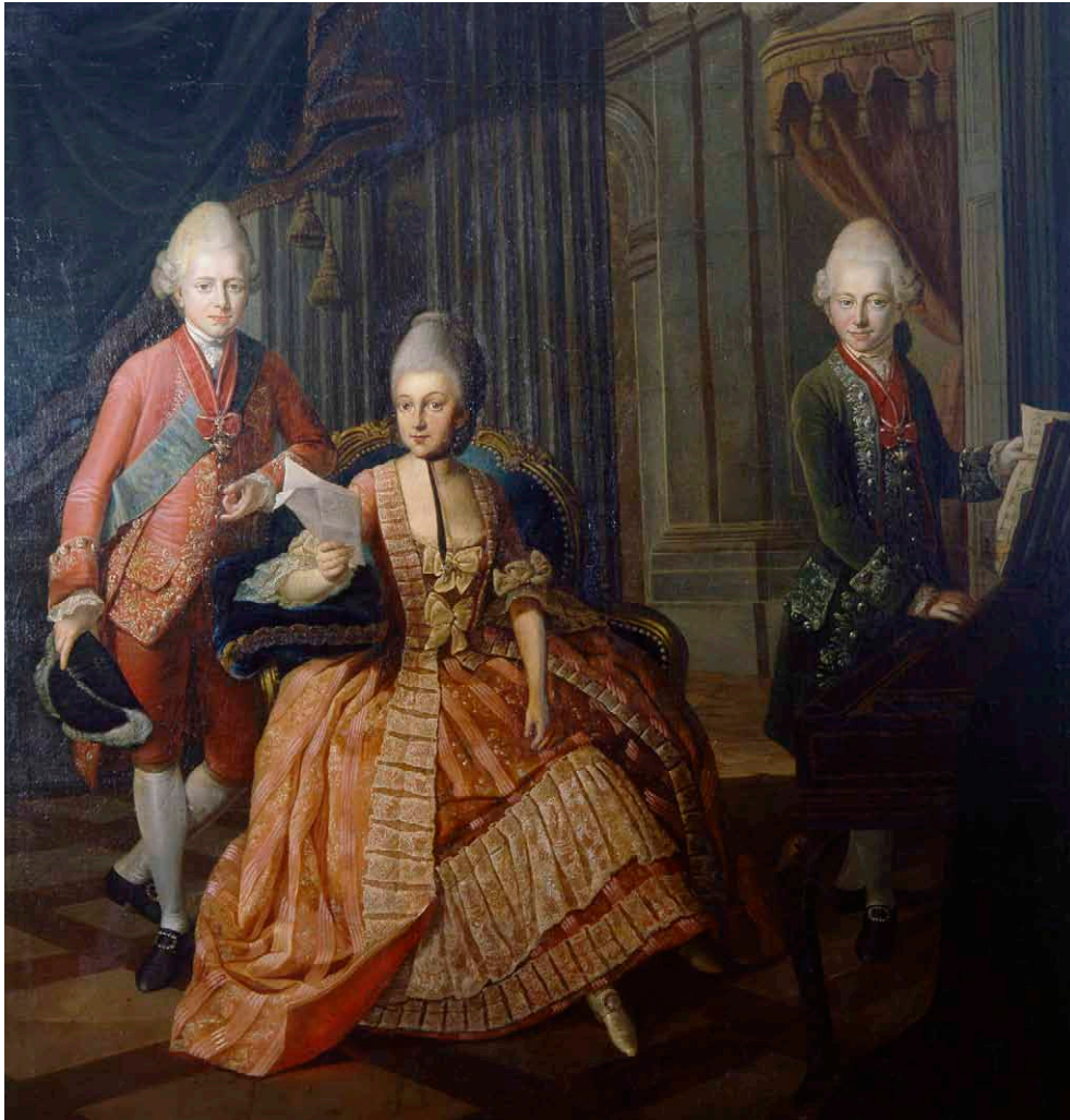
Anna Amalia mit ihren Söhnen Carl August und Constantin

Wer war Herzogin Anna Amalia von Sachsen-Weimar-Eisenach? Und wieso ist sie die Namensgeberin dieser Bibliothek? Diese Fragen haben sich vielleicht schon einige von euch gestellt. Uns ging es nicht anders.