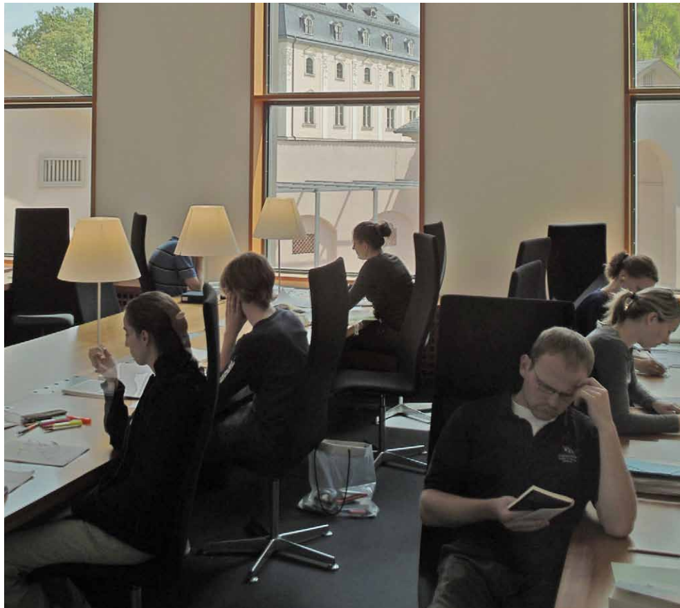
Im Lesesaal – intensives Arbeiten mit historischen Drucken

Träger der Bibliothek ist die Klassik Stiftung Weimar. Wegen seiner großen kunsthistorischen Bedeutung gehört das Historische Bibliotheksgebäude seit 1998, zusammen mit anderen Klassiker-Stätten, zum Weltkulturerbe der UNESCO. Da der Bestand über die Jahre stetig anwuchs und dadurch ein massiver Rummangel im Grünen Schloss herrschte, mussten über 80 Prozent des Buchbestandes auf Ausweichmagazine verteilt werden. Es gab einfach keinen Platz mehr für all die Bücher. Also musste über eine Lösung nachgedacht werden. Hinzu kommt, dass das Grüne Schloss längst sanierungsbedürftig war und erst einmal geräumt werden musste. Nur wohin mit den Büchern? Schon seit längerem wurde über ein neues Studienzentrum nachgedacht. Bei der Standortfrage entschied man sich, genau wie Herzogin Anna Amalia einst, für ein bereits bestehendes Gebäude, da die Erweiterung vor allem in unmittelbarer Nähe zum Historischen Gebäude realisiert werden sollte. Dieses Schloßensemble, aus Rotem und Gelbem Schloss, wurde bis 1995 von der Stadtverwaltung genutzt und diente der Bibliothek außerdem als Ausweichmagazin. Im Jahr 2000 gewann eine Architektengemeinschaft aus Weimar und Erfurt den international ausgeschriebenen Wettbewerb zur Realisierung dieses 23 Millionen Euro teuren Projektes, und 2001 konn-