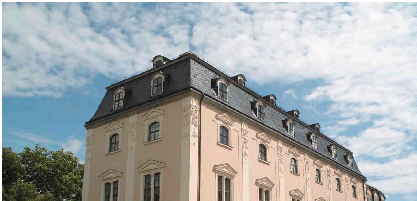
In neuem Glanz – das Grüne Schloss

ner Seele, dass ich nicht zu mir selber kommen konnte. Ein Zusammenfluss von Ideen, von Gefühlen, die alle unentwickelt waren, kein Freund, dem ich mich aufschließen konnte. Ich fühlte meine Untüchtigkeit, und dennoch musste ich alles in mir selber finden.«