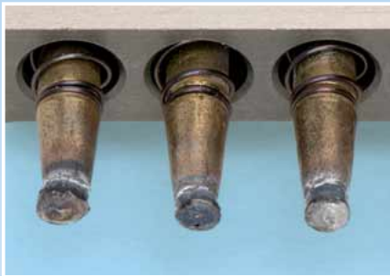
Abgebrannte Elektroden durch zu lange Schweißzeit.