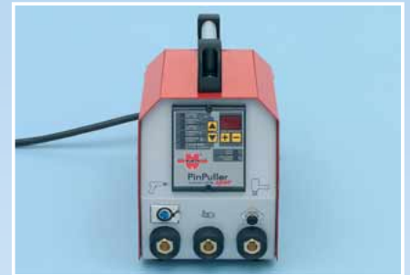
Optimale Arbeitsergebnisse durch PinPuller®-Spot Art.-Nr. 0691 500 290.