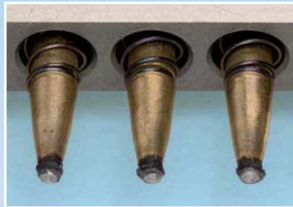
Ideale Elektroden mit Aufbau, der einfach wieder abgefeilt werden kann.