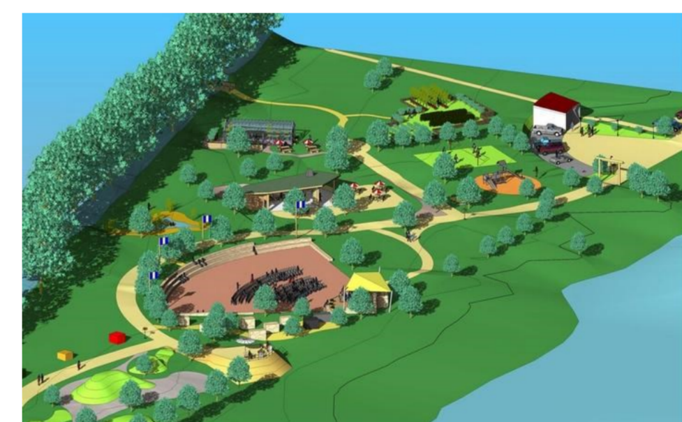
Beispiel einer Flächenbereitstellung in Allenbach; Alt (links oben) Neu (rechts oben) Plan (unten)