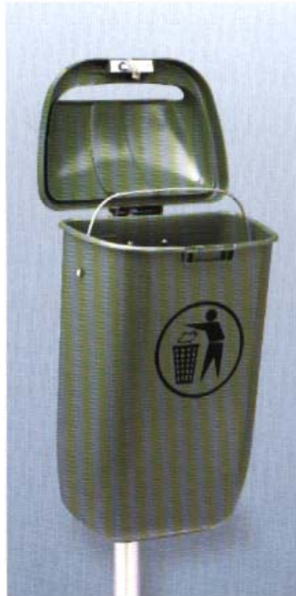
Der geöffnete Deckel legt den Tragebugel frei