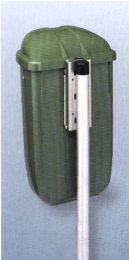
Korrosiongeschützte Befestigungsbleche (Rohrpfahl) als Zubehör lieferbar