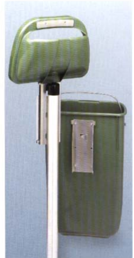
Hygienisch und problemlos zu entleeren