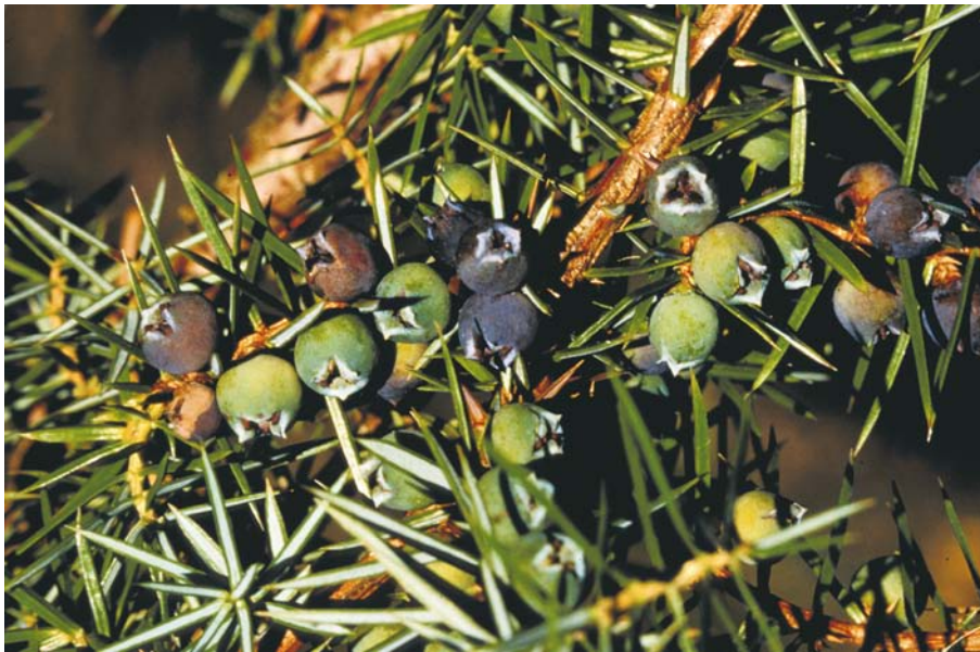
Abb. 4: Beerenzapfen („Wacholderbeeren“)

Der Wacholder ist zweihäusig, ausnahmsweise können aber auch Pflanzen mit Blüten beiderlei Geschlechts auftreten. Männliche Individuen erkennt man zur Blütezeit im Frühjahr gut an den 4 bis 5 mm großen, gelblichen Blüten, deren Pollen der Wind verfrachtet. Unscheinbar und kaum von einer Knospe zu unterscheiden sind die weiblichen Blütenstände, gebildet aus mehreren Wirteln von Schuppenblättern, von denen die drei obersten je eine Samenanlage tragen. Die Befruchtung erfolgt erst ein knappes Jahr nach der Bestäubung. Die drei Samenschuppen verwachsen daraufhin und bilden die im reifen Zustand (im zweiten Herbst nach der Blüte) blau bis fast schwarz und oft weißlich bereifte Wacholderbeere. Die Samen verbreiten Tiere (zoochor), hauptsächlich Vögel, allen voran die Wacholderdrossel, aber auch andere Drosselarten, Birk- und Haselhühner sowie verschiedene Säugetiere.