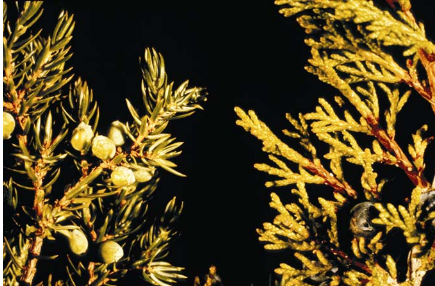
Abb. 5: Zwergwacholder ( J. communis ssp. alpina , links) und Sadebaum ( J. sabina , rechts)

Wacholderbeeren enthalten etwa 30 % Zucker und 0,5 bis 2,5 % ätherisches Öl (Sabinen, Pinen, Myrcen u.a.). Auf Grund des hohen Zuckergehaltes lassen sie sich gut vergären. Das ätherische Öl geht beim Brennen ins Destillat über und verleiht den bekannten, aus Wacholder gebrannten alkoholischen Getränken wie Genever, Gin oder Steinhäger den typischen Geschmack.