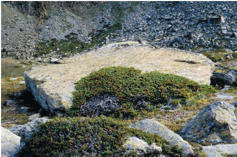
Abb. 3: Zwerg- oder Bergwacholder, Juniperus communis ssp. alpina, auf 2500 m Höhe im Wallis

Juniperus communis ist extrem anspruchslos und konkurrenzschwach. Trotzdem ist er unter den Gehölzen (sieht man einmal von einigen Zwergsträuchern ab) bezüglich horizontaler und vertikaler Verbreitung „Weltmeister“. Das Areal umfasst den größten Teil des eurasiatischen Raumes von Europa und Nordafrika über West- und Zentralasien (insbesondere Sibirien) bis nach Ostasien (Japan und Korea). In Nordamerika kommt der Gemeine Wacholder vor allem in Kanada und Alaska vor, ist aber auch in den Gebirgen der USA bis weit in den Süden verbreitet, wenngleich hier nur noch in vielen, mehr oder weniger kleinen und voneinander isolierten Rückzugsgebieten. Rekordverdächtig ist vor allem auch die Vertikalverbreitung. Wacholder findet man von Meereshöhe über alle Höhenstufen hinweg bis über die alpine Wald- und Baumgrenze hinaus. In den Alpen steigt der Zwergwacholder am Monte Rosa bis knapp über 3.500 m (verschiedenen Angaben zufolge ist das der höchste Standort einer Holzpflanze in Europa), in Kalifornien ein ähnlicher Ökotyp der Art bis 3.400 m und in den Rocky Mountains (Wyoming) sogar bis 3.955 m.