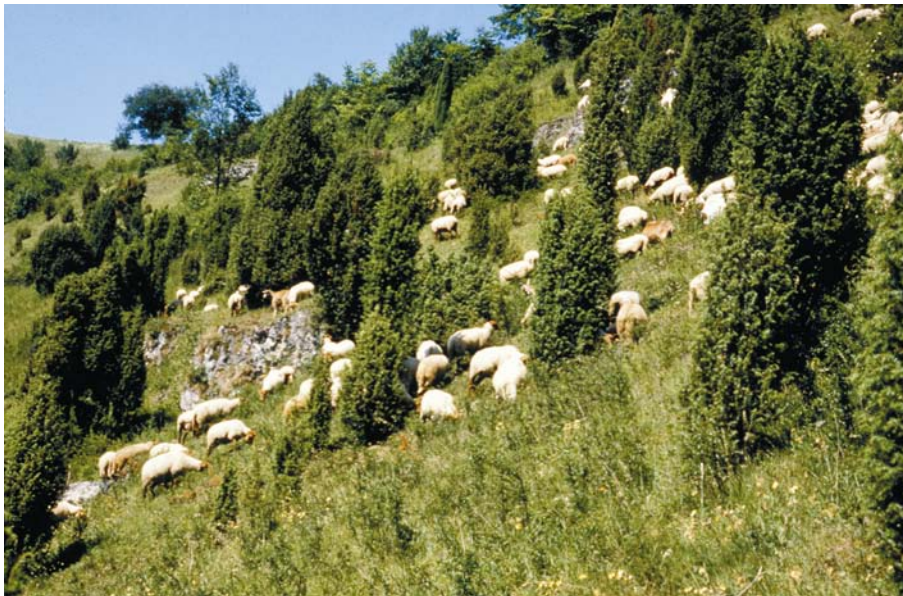
Abb. 1: Wacholderheide in der nördlichen Frankenalb (Kleinziegenfelder Tal)

Wenngleich kein forstlicher Primus, so ist der Gemeine Wacholder ( Juniperus communis ) doch eine ganz besondere Holzart. Sie ist die am weitesten verbreitete Konifere der Welt, wenn nicht sogar die am weitesten verbreitete Baumart überhaupt, und dies, obwohl sie unter den einheimischen Baumarten sicher eine der konkurrenzschwächsten ist. Von Natur aus wäre der Wacholder deshalb eine ganz seltene Art und nur dort vertreten, wo extreme Trockenheit und großer Mangel an Nährstoffen andere Bäume nicht wachsen lassen. Größere Verbreitung erreichte er erst in vom Menschen devastierten, lichten Wäldern und auf extensiv genutzten Weiden. Da ausgeplünderte Wälder bei uns mehr und mehr der Vergangenheit angehören, ebenso wie die Wanderschäferei im großen Stil, nimmt der Lebensraum für den lichthungrigen Wacholder wieder ab.