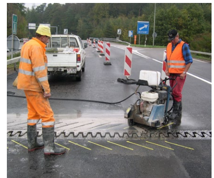
Schneiden der Schlitzte in einem 45° Winkel zur Fahrtrichtung

Auf unserer Website mageba-group.com finden Sie weitere Produktinformationen sowie Referenzlisten und Ausschreibungsunterlagen.