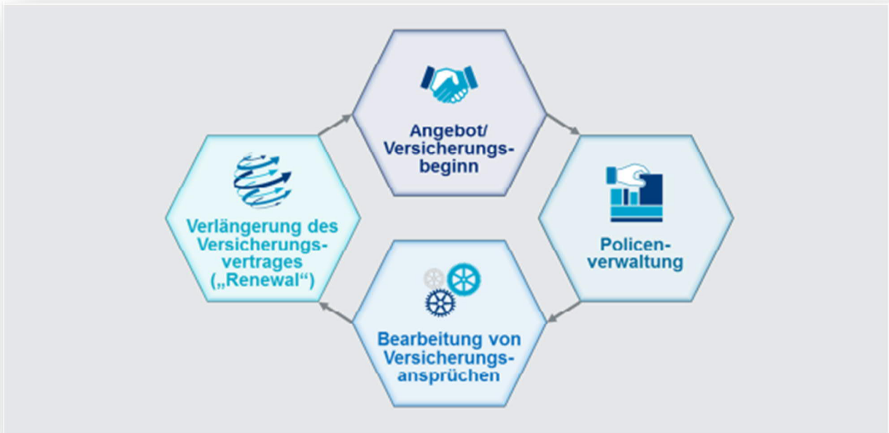
GRAFIK 2: FLUSS PERSONENBEZOGENER DATEN DURCH DEN VERSICHERUNGSLEBENSZYKLUS