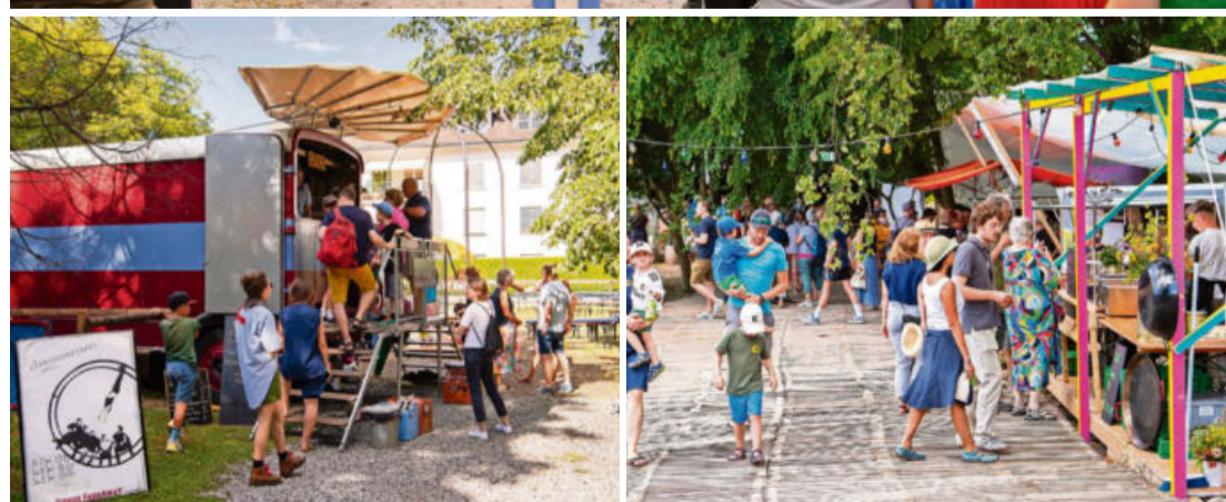
Das Hinterhalt-Festival sucht sich jedes Jahr einen neuen Ort. Diesmal waren der Garten des Werkheims Uster und der Friedhof die Bühne.