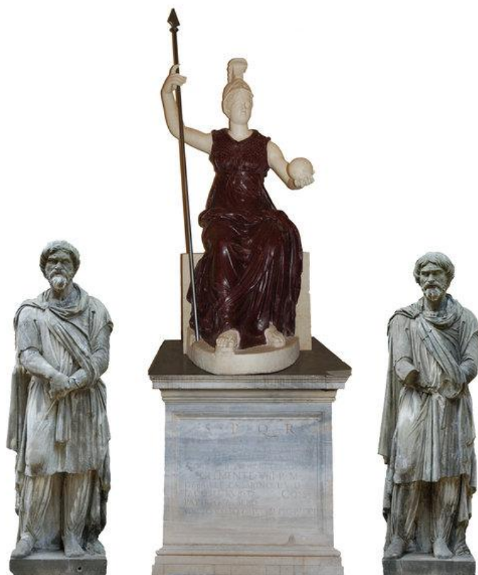
Die Gruppe der „Roma triumphans“. Rekonstruktion der Aufstellung in der Villa Cesarini.

Dies hat nicht nur kunsthistorische, sondern auch lokalpolitische Bedeutung, denn die Roma Capitolina ist eines der wichtigsten Objekte der kommunalen Repräsentation der Stadt Rom. Ihre Herkunft aus der Sammlung Cesarini war bislang unbekannt [4].