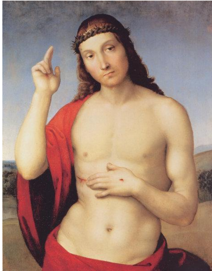
Raffael, Der Segnende Christus. Brescia, Pinacoteca Tosio Martinengo.