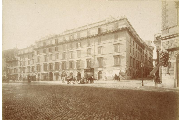
Der ehemalige Palazzo Cesarini bei Largo Argentina. Aufnahme von 1886, Museo di Roma.

der antiken Tempelanlagen bei Torre Argentina weichen musste ( Abb. 1 ).