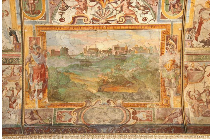
Vedute von Ardea mit den mythischen Widersachern Aeneas und Turnus. Fresko in der Loggia der Villa Cesarini in Rom.

Durch diesen Hinweis inszenierte sich Giovan Giorgio Cesarini nicht allein als Feudalherr über Ardea, sondern zugleich als Nachfahre des Aeneas, des mythischen Helden von Troja und Stammvaters der Römer. Zeitgenössischen Besuchern der Villa wird die Anspielung unschwer aufgefallen sein, zumal ihnen gleich am Eingang der Villa deutlich vor Augen geführt wurde, dass es Giovan Giorgio Cesarini mit seinem Anspruch, als Gonfaloniere die Stadt Rom zu repräsentieren, durchaus ernst meinte. Cesarini hatte nämlich im Hof der Villa eine große Skulpturengruppe der Roma triumphans aufstellen lassen. Vorbild war die berühmte Roma -Gruppe im Garten des Palazzo Cesi, die heute im Hof des Konservatorenpalastes steht. Auch in der Villa Cesarini thronte die Allegorie der Roma auf einem hohen, von zwei kolossalen Statuen gefangener Barbaren flankierten Podest. Die Statue der Roma war aus seltenem Porphyr, einem Material, das einen imperialen Anspruch signalisierte. Die Gruppe wurde 1593 demontiert; im Rahmen des Forschungsprojektes gelang es jedoch, die einzelnen Elemente nachzuweisen. Die Roma befindet sich seit 1593 auf dem Kapitolsplatz in Rom und die beiden Barbaren im Garten der Villa Ludovisi. Nun ist es möglich, die Gruppe so zu rekonstruieren, wie sie sich Besuchern der Villa Cesarini präsentierte ( Abb. 6 ).