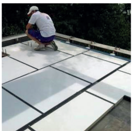
Einsatzbezogene Vakuumdämmpaneele für Flachdach, Balkon und Terrasse

Über 20 fertig konfektionierte VAKUUMDÄMMUNGSPANEELE für jeden Einsatzbereich, natürlich mit EU-Zulassung!