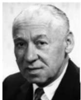
Ladislav Meduna 1896–1964

Ladislav Meduna untersuchte in den 1930er Jahren an der psychiatrischen Klinik in Budapest die Wirkung von generalisierten Anfällen, die er durch Injektion von Kampfer auslöste, zunächst im Tierversuch und ab 1934 bei schizophrenen Patienten. Hieraus entwickelte er die pharmakologische Konvulsionstherapie. Sie eröffnete eine völlig neue Perspektive für die Behandlung schwerer psychischer Erkrankungen.