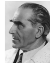
Ugo Cerletti 1877–1963

Ladislav Meduna untersuchte in den 1930er Jahren an der psychiatrischen Klinik in Budapest die Wirkung von generalisierten Anfällen, die er durch Injektion von Kampfer auslöste, zunächst im Tierversuch und ab 1934 bei schizophrenen Patienten. Hieraus entwickelte er die pharmakologische Konvulsionstherapie. Sie eröffnete eine völlig neue Perspektive für die Behandlung schwerer psychischer Erkrankungen.