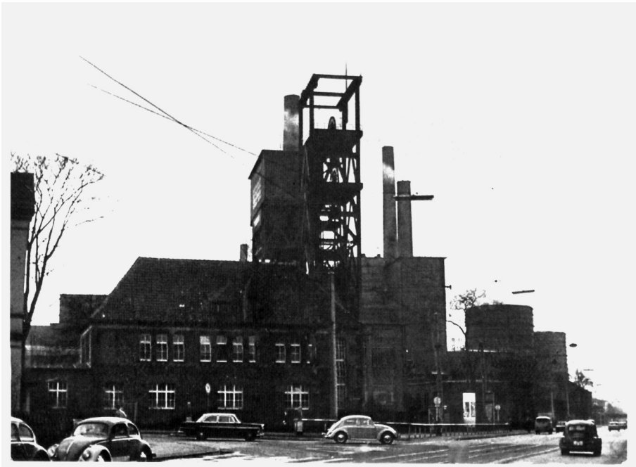
Abb. 7: Die zentrale Evinger Kreuzung in den 1960er Jahren: Evings Mitte war die Zeche.

baulichen Mangel: das Fehlen einer Ortsmitte. Individueller wie kollektiver Bezugspunkt der über 100jährigen räumlichen Entwicklung waren Zeche und Kokerei gewesen, um die sich Industrievororte lagerten, die ungeplant einen ländlichen Raum überformten.