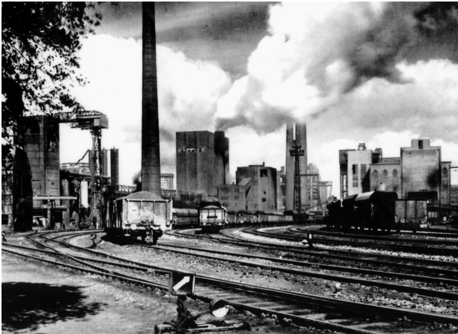
Abb. 8: Minister Stein in den 1950er Jahren

Bei einer Vorführung der Signalglocke, bei der Vertreter der Bezirksvertretung, des City-Marketings, des Geschichts- und Kulturvereins und der Grubenwehrkameradschaft zugegen waren, winkte der Investor des Dienstleistungszentrum unter dem Hammerkopfturm ab: Er verweigerte eine Einwilligung zur Anbringung. Es sollten doch auf keinen Fall angeworbene wie potentielle Mieter durch die Lärmbelästigung abgeschreckt werden!