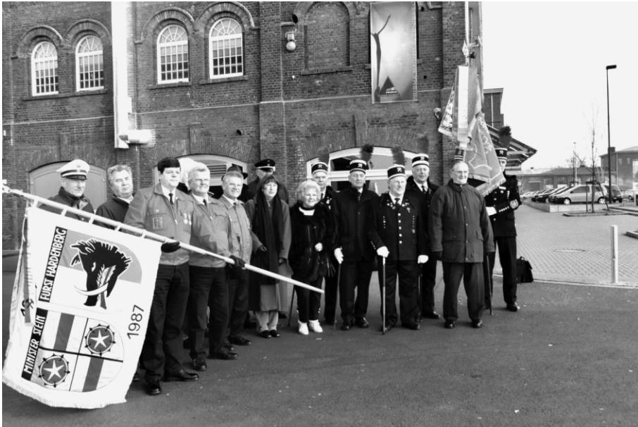
Abb. 2: Einweihung am 31. Januar 2003 zusammen mit Mitgliedern der Grubenwehrkameradschaft, des Knappenvereins, des City-Marketings und des Evinger Geschichts- und Kulturvereins.