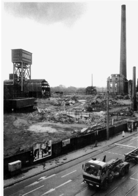
Abb. 4: Nach dem Ende der Förderung begann der Abriss. Rund um „Schacht 4“, hier noch mit der ehemaligen Hängebank, kamen Abrissbirnen und Bagger zum Einsatz.

Zusammen mit den Füllorten unter Tage und der Hängebank über Tage bestand die Kohleförderung aus einer Vielzahl von minutiös aufeinander abgestimmten Arbeitsvorgängen. Der Verständigung dienten verschiedene Signaleinrichtungen wie Signalglocken, elektrische Signaltafeln und Telefone. Die fest vorgeschriebenen Signalzeichen waren auf Anschlagtafeln an den Arbeitsplätzen (im Fördermaschinenhaus, an der Hängebank und an den