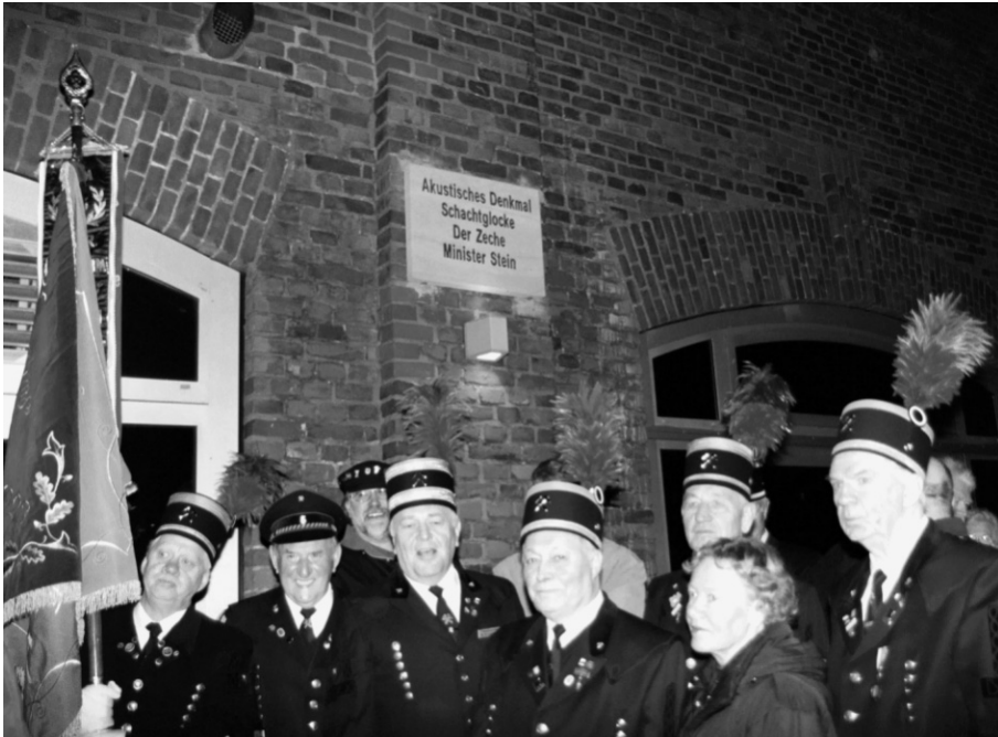
Abb. 3: Am 28. November 2003 wurde das Denkmal in einem erneuten Festakt durch eine Hinweistafel ergänzt. Zu sehen sind Mitglieder des Knappenvereins.

Hunderttausende waren zu Spitzenzeiten direkt oder indirekt mit dem Bergbau in Dortmund verbunden und erlebten Höhepunkte und Krisen. 1871 begannen die Abteufarbeiten für den ersten Schacht des Bergwerks Minister Stein , 1875 förderte die Zeche erstmals mit 90 Mann Belegschaft 740 t Kohle. 5 Der Zechenname erinnerte an den Reichsfreiherrn Heinrich Friedrich Karl vom und zum Stein (1757-1831), der nicht nur Reformen im Regierungssystem, Behördenwesen, in der Sozialstruktur, in der Kommunalverfassung, im Militär und im öffentlichen Bildungswesen durchsetzte, sondern als erster Leiter der staatlichen Bergbauverwaltung in den preußischen Westprovinzen auch im Bergwesen entscheidende Impulse setzte: so regte er zum Beispiel an, im westfälischen Bergbau „Feuermaschinen“, d.h. Dampfmaschinen einzusetzen. 6