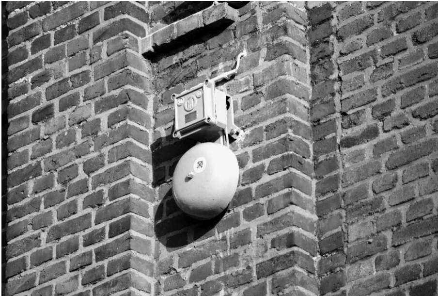
Abb. 1: Das akustische Denkmal in Dortmund Eving.

„Jahre nach der Zechenstilllegung“ 1 – zu einem Zeitpunkt, als im Zuge des sozio-ökonomischen Strukturwandels des Ruhrgebiets die einstmals gewaltige Produktionsstätte bis auf einige denkmalgeschützte Überreste „plattgemacht war“, kam ehemaligen Bergleuten der Dortmunder Zeche Minister Stein die Idee, ein akustisches Denkmal zu schaffen. Es basiert als Sachüberlieferung auf einer originalen Signalanlage, die den Arbeitsalltag des Bergmanns bestimmte. Am 31. Januar 2003 wurde unter Anteilnahme der örtlichen Presse in Dortmund-Evings „Neuer Mitte“ erstmalig und einmalig ein akustisches Denkmal eingeweiht. Am 28. November 2003 wurde es in einem erneuten Festakt durch eine Hinweistafel ergänzt. 2