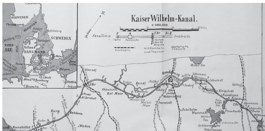
Abb 1.: Karte des Nord-Ostsee-Kanals.

Einen Kanal zu bauen, heißt vor allem zu graben. Und im Falle des Nord-Ostsee-Kanals bedeutete es, sehr viel zu graben. Immerhin ist die Wasserstraße fast 100 km lang und war nach zehn Jahren Bauzeit bei ihrer Fertigstellung 1895 rund 9 m tief und 65 m breit (Abb. 1). Es waren die in dieser Zeit ausgehobenen 52 Mio. m 3 Erdreich, die für die zeitgenössische Bezeichnung „Riesenwerk“ ausschlaggebend waren. 3 Der Kanal war zugleich eines jener Projekte, die während der Industrialisierungsphase in mehreren Ländern verwirklicht wurden und einen wesentlichen Beitrag nicht nur zur Entfaltung moderner Mobilität und großräumiger Märkte, sondern auch zum Ausbau staatlicher Macht leisteten. Im Mittelpunkt dieser Untersuchung stehen hier jedoch weder die Bedeutungen, Erwartungen und Befürchtungen von Politik, Militär oder Wirtschaft, die zur Entscheidung des Reiches zum Bau um den Jahreswechsel 1885 und 1886 geführt hatten, noch die Wirkungsgeschichte dieses Stückes technischer Infrastruktur auf Militärstrategie, Handel oder Umwelt. Im Mittelpunkt steht die Baustelle des Nord-Ostsee-Kanals, konkreter die Herausforderungen, die Arbeiter und Ingenieure bewältigen mussten, die