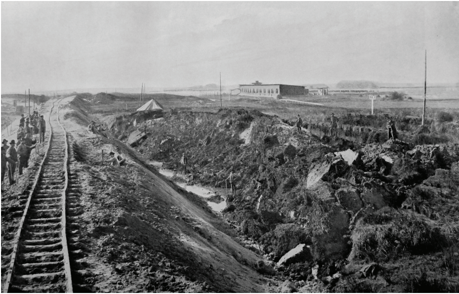
Abb. 2: Mooraufreibung an Sanddammschüttung, Oktober 1891.

von der Fülle der Detailprobleme, die beim Bau des Kanals gelöst werden mussten. Zuerst geht es zur Region um den Kudensee im Westen des Kanals, wo die Trasse durch mooriges Gebiet führt. Beim Flemhuder See im bergigen Ostholstein waren Wasser und Erde so widerspenstig, dass die ursprünglichen Pläne aufgegeben werden mussten. Während in diesem zweiten Bauabschnitt die aufsässigen Elemente einen Achtungssieg erzielen konnten, wurde der Bau der Schleusen schließlich realisiert. Besonders problematisch war das Westende des Kanals, wo die großen Becken in der weichen Elbmarsch errichtet wurden.