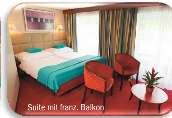
Suite mit franz. Balkon