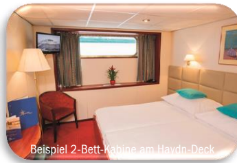
Beispiel 2-Bett-Kabine am Haydn-Deck