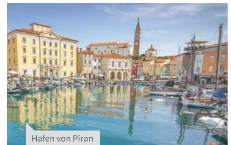
Hafen von Piran