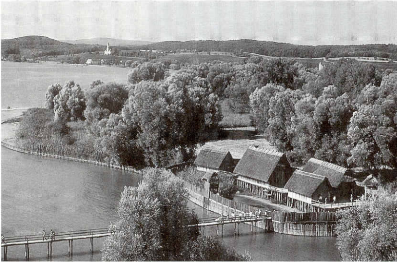
Pfahlbaumuseum Unteruhldingen.

1 Museen unter Rentabilitätsdruck. Engpässe, Sackgassen, Auswege. Bericht über ein internationales Symposium vom 29. bis 31. Mai 1997 am Bodensee, veranstaltet von den ICOM Nationalkomitees Deutschlands, Österreichs und der Schweiz, hrsg. von Hans-Albert Treff, München 1998 – versch. Beiträge.