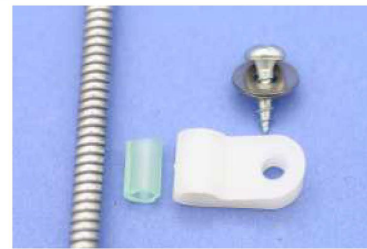
3. Schelle mit Klemmeinlage und Befestigungsschraube