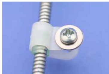
4. Schelle mit Klemmeinlage auf Bowdenzug geschoben