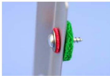
2. Befestigungsschraube für Moderatorleiste