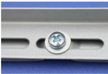
1. Verschraubung der Moderatorleisten

Das Aufkleben des Moderatorfilzes sollte mit Kontaktkleber (Pattex) erfolgen.