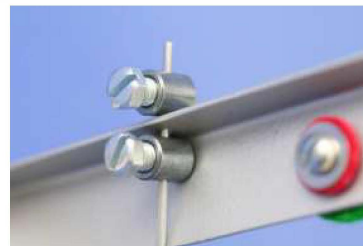
5. Bowdenzugende mit Klemmnippel an Moderatorleiste befestigt