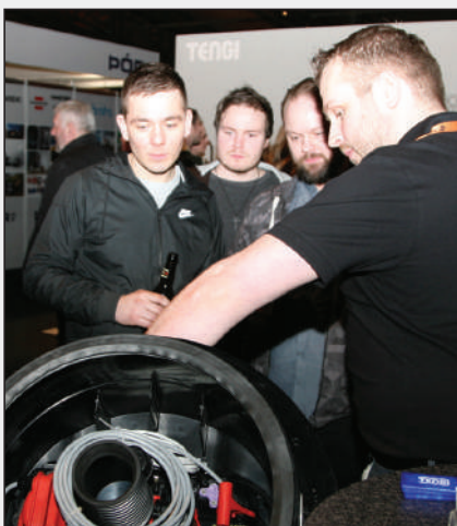
Frá sýningunni Verk & Vit 2018.