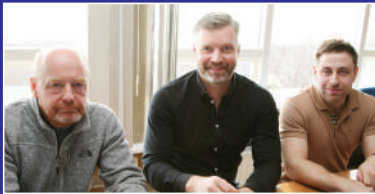
Myndir frá Aðalfundi FP 2019.