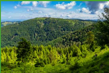
Schont den Waldbestand