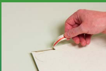
Leichtes, bequemes Öffnen