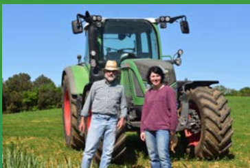
Aus regionaler Landwirtschaft