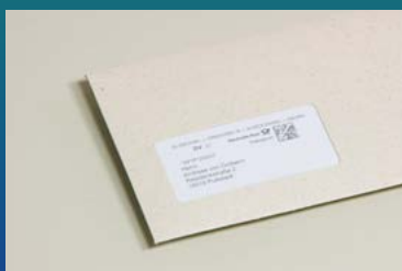
Mit und ohne Adressfenster (Papier)