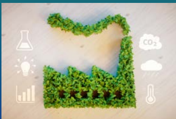
Weniger Chemie & weniger CO2