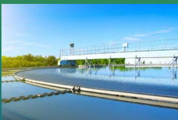
Deutlich weniger Wasserverbrauch