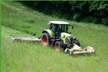
Schnell nachwachsender Rohstoff