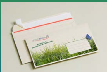
Attraktiv &amp; gut bedruckbar