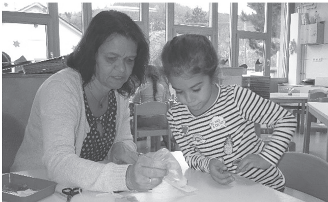
...ein Adventskranz gebunden und geschmückt...