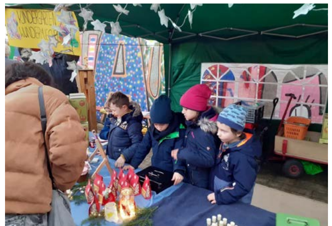
Unsere fleißigen Verkäufer