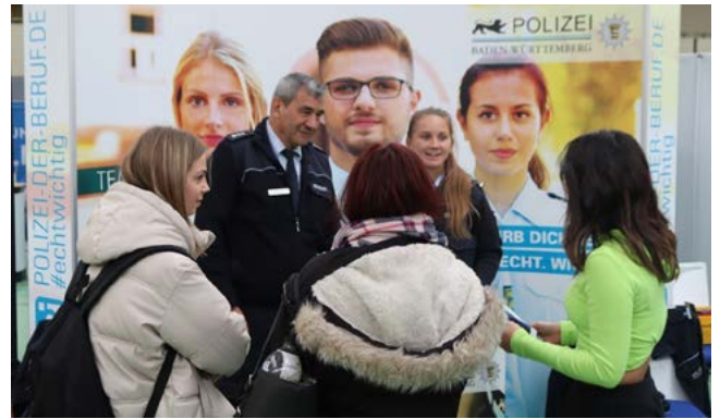
Messestand der Polizei Baden-Württemberg