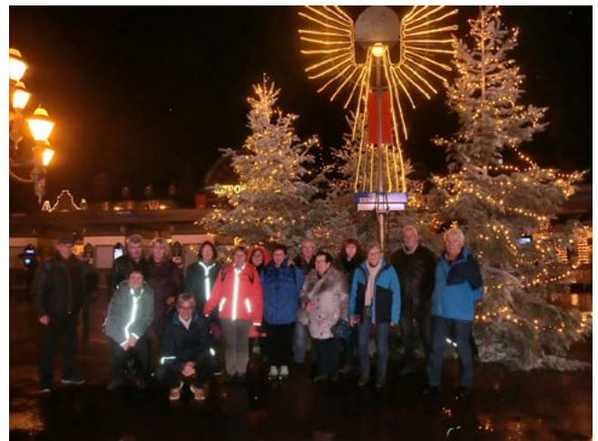
Ein kleiner Teil der Ausflügler

VdK-Ortsverband Rangendingen SOZIALVERBAND VdK