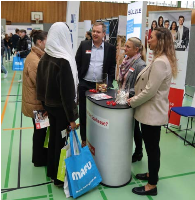
Auch die Sparkasse Zollernalb warb auf der Ausbildungsmesse des BSZ um neue Azubis

„Die bisherigen Rückmeldungen der Aussteller sind durchweg positiv“, zeigte sich Studienrätin Alice Blocher mit der Ausbildungsmesse hochzufrieden. Von Ausstellerseite wurden speziell die neue Location, der Service durch das Organisationsteam, der gleichmäßige Besucherstrom und die Betreuung der Schülerinnen und Schüler durch die Lehrkräfte gelobt. Auch bei den Schülerinnen und Schülern kam die Messe sichtlich gut an, weshalb sich Frau Blocher zuversichtlich zeigte, dass durch die Messe einige Ausbildungsplätze und duale Studienplätze besetzt werden können. Nächstes Jahr ist geplant, die Messe in den Nachmittag zu verlängern, damit noch mehr andere Schulen als dieses Jahr von der Ausbildungsmesse profitieren können.