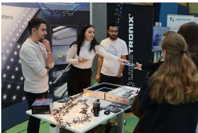
Die Hechinger Firma Lumitronix informierte über ihre Ausbildungsmöglichkeiten