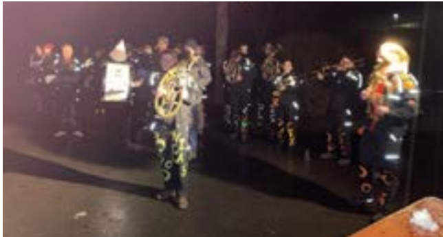
D'Schugger spielte nach der Zeremonie noch ein paar Fasnteslieder