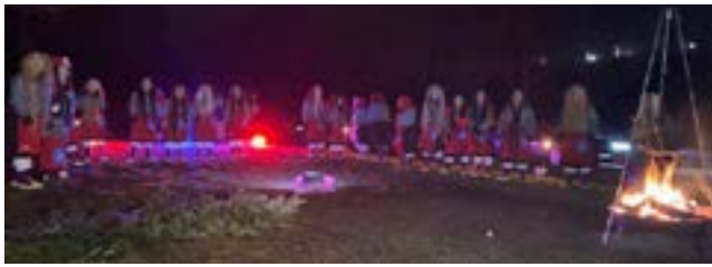
Alle getauften Hexen