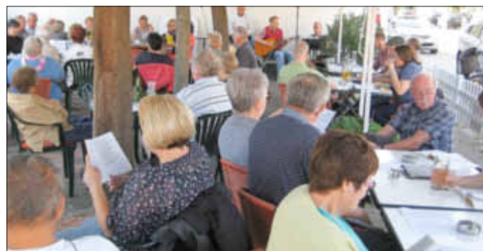
„Wo man singt da lass dich nieder...“ - Große Sängerschar beim Volkslieder-Singen in Leimersheim“

Pünktlich um 19.00 Uhr griffen die Musiker in ihre Tasten beziehungsweise Saiten und starteten mit dem Klassiker „Kein schöner Land in dieser Zeit“ das rund zweistündige Unterhaltungsprogramm.