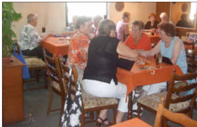
Die Gruppe des PWV bei ihrem Spielnachmittag im Seniorentreff in Leimersheim.

Am Mittwoch, den 08.07.15 bietet der PWV Leimersheim für alle begeisterten Radfahrer eine Radtour nach Hatzenbühl an. Unser Weg führt uns von Leimersheim auf dem Radweg nach Neupotz am Otterbach entlang, Richtung Rheinzabern.