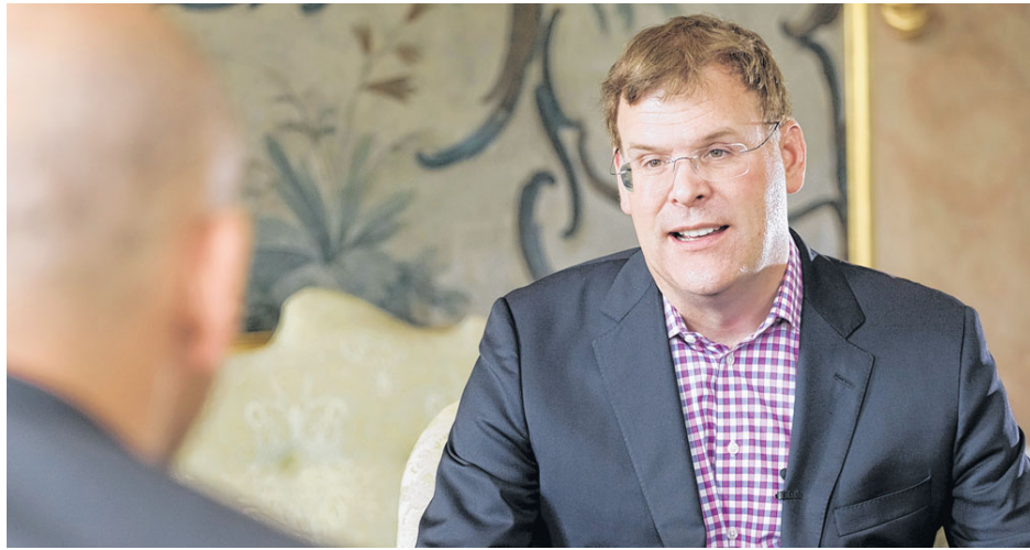
John Baird über die Krise in Syrien: „Wir können niemals genug tun, um auf eine humanitäre Krise wie diese zu antworten.“

ist seit 2011 Kanadas Außenminister. Der 45-jährige Konservative war auf Einladung des Salzburg Global Seminars und des International Peace Institutes in Salzburg.