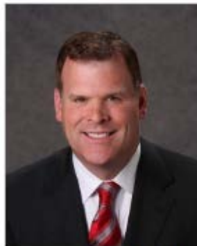
Canada's Foreign Affairs Minister John Baird Visits Austria and The Balkans

Canada's Foreign Affairs Minister John Baird today announced that he will visit Croatia, Serbia and Albania. The visit to the Balkans comes after Baird spoke about Ukraine and other global security issues at a high-level forum in Salzburg, organized by the International Peace Institute and the Salzburg Global Seminar.