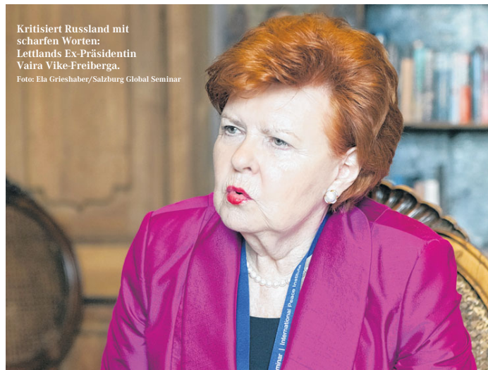
Kritisiert Russland mit scharfen Worten: Lettlands Ex-Präsidentin Vaira Vike-Freiberga.

Vaira Vike-Freiberga: Das ist eine der großen Fragen für mindestens die kommenden zehn Jahre. Wie können wir mit einer Person umgehen, die in systematischer und geplanter Weise eine Vision Russlands und seiner Position in der Welt hat, die sich mehr und mehr von dem Konzept entfernt, das nach dem Kollaps der Sowjetunion von allen akzeptiert war? Die Haltung im Westen war damals, dass wir – als vormaligen von der Sowjetunion annektierte Länder – lobbyieren mussten, damit uns erlaubt wird, zur westlichen Gemeinschaft zurückzukehren. Man fürchtete, Russland könne zornig werden. Ich versichere Ihnen, dass das Russland unter Ex-Präsident Boris Jelzin komplett anders agierte. Es ist wichtig, die Welt daran zu erinnern, dass Russland damals die Ukraine anerkannte und ihre territoriale Integrität garantierte. Russland unterzeichnete mit den westlichen Alliierten sogar ein Abkommen, die Souveränität und Unabhängigkeit der Ukraine zu garantieren. Dafür gaben die Ukrainer ihr großes Atomwaffen-Arsenal auf. Nun hören wir das Argument, dass wir vorsichtig sein müssen. Die Ukrainer dürfen ebenso wenig wie die