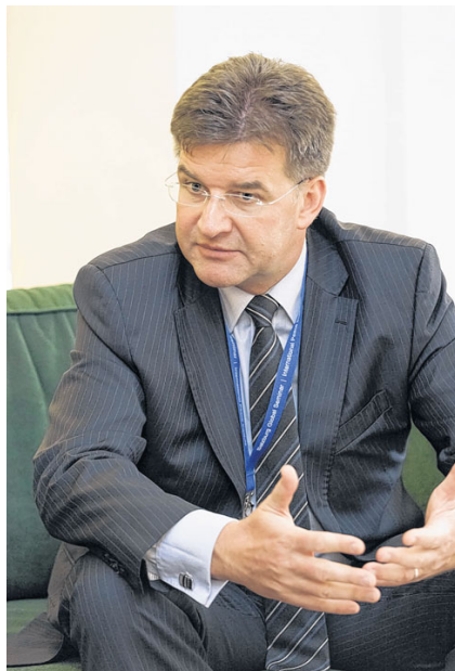
Sanktionen gegen Russland seien erfolgreich, wenn sie helfen, einen politischen Prozess zu starten, sagt Lajcak.

Es ist immer schwierig, eine Liste von Ländern aufzustellen. Wir haben eine gemeinsame Position aller 28 EU-Länder. Und dann gibt es diverse Äußerungen. Sehr oft unterzeichnen jene, die besonders scharfe Aussagen machen, Verträge mit Russland. Wir sind nicht durch scharfe Äußerungen gegenüber Russland aufgefallen, haben der Ukraine aber gleichzeitig ermöglicht, 40 Prozent ihres Gasbedarfs zu bekommen. Unsere Investition hat das ermöglicht, dafür haben wir kein Geld von der EU-Kommission oder sonst irgendjemandem bekommen. Jeder hat seine eigene Geschichte und Emotionen mit Russland. Wir können uns nicht gegenseitig für diese oder jene gemeinsame Geschichte mit Russland beschuldigen. Ich glaube, die zentraleuro-