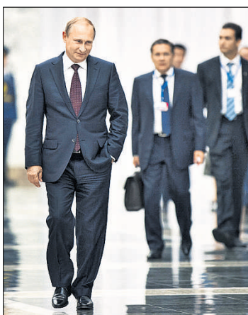
Putin nach seinem Treffen mit Poroschenko in Minsk.

Nach dem Treffen mit seinem russischen Amtskollegen Wladi-