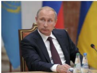
Илларионов рассказал, что может остановить Путина