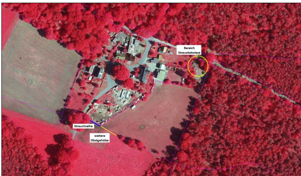
Abb. 41: Neben der Anlage einer Streuobstwiese wird auf einer Länge von ca. 20 lfm eine Hecke angelegt, daran anschließend werden weitere einzelne Obstgehölze, als Ergänzung bereits vorhandener Bäume auf der Wiese, gepflanzt

Neben der Anlage einer Streuobstwiese wird auf einer Länge von ca. 20 lfm eine Hecke angelegt, daran anschließend werden weitere einzelne Obstgehölze, als Ergänzung bereits vorhandener Bäume auf der Wiese, gepflanzt.