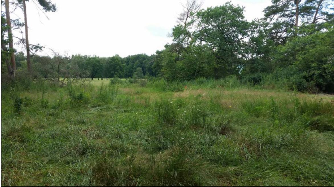
Abb. 40: der Bereich der Torfhauswiese, der mit der Pflanzung von Obstgehölzen zu einer Streuobstwiese entwickelt werden soll

Neben der Anlage einer Streuobstwiese wird auf einer Länge von ca. 20 lfm eine Hecke angelegt, daran anschließend werden weitere einzelne Obstgehölze, als Ergänzung bereits vorhandener Bäume auf der Wiese, gepflanzt.