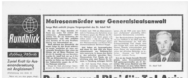
Ausschnitt Junge Welt 26.5.1967