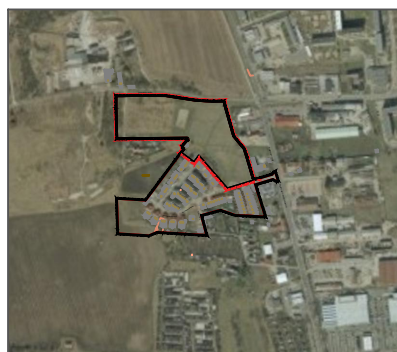
Auszug aus dem Luftbild ohne Maßstab

Grenze des räumlichen Geltungsbereichs des Bebauungsplans