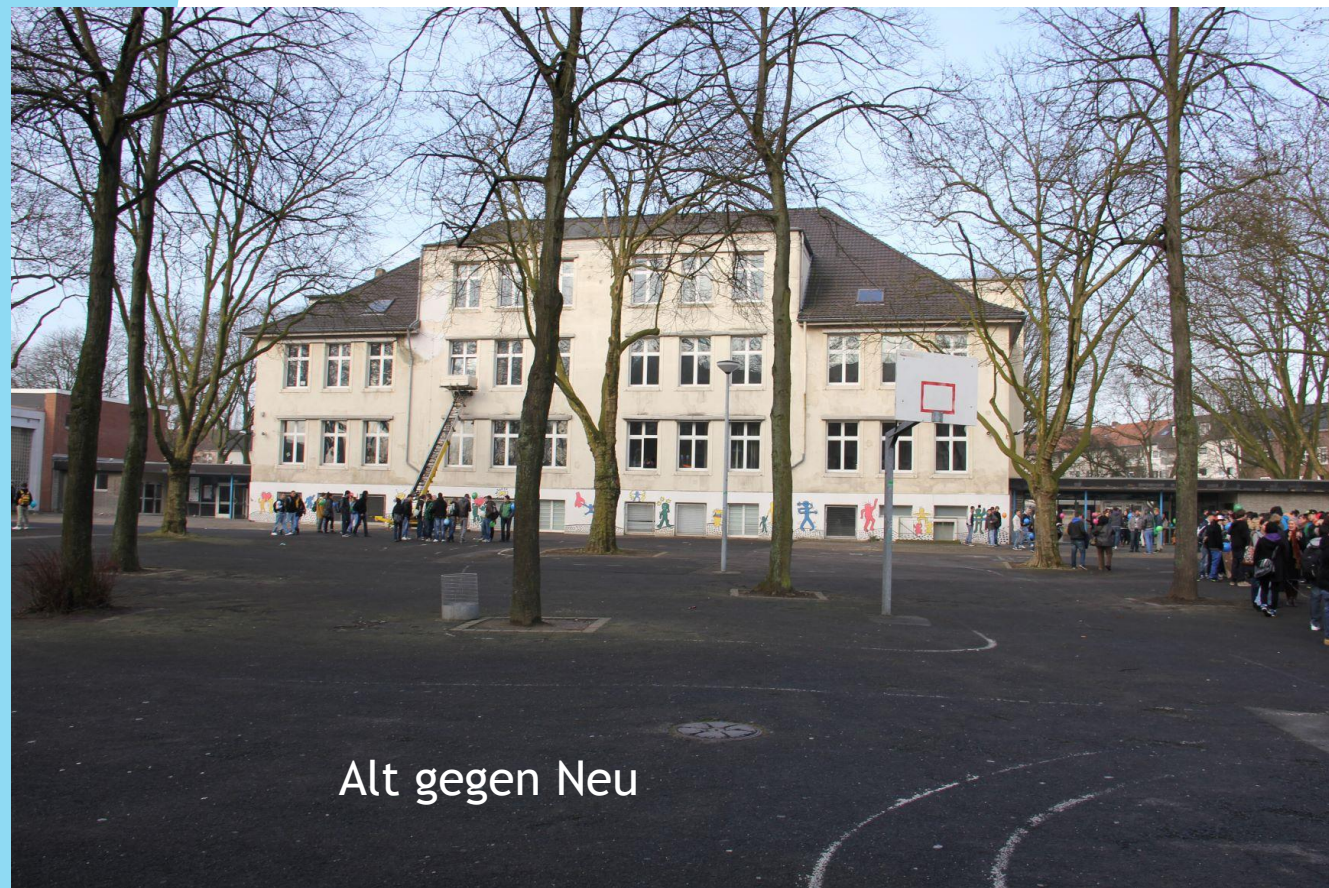
Alt gegen Neu