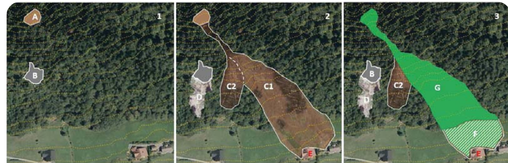
Abbildung 1: Schema der notwendigen Schritte zur Identifikation von Waldflächen mit direkter Objektschutzfunktion: 1. Identifikation potenzieller Anbruchflächen (A, B) der Gefahrenprozesse und 2. Bestimmung aller potenziellen Sturzbahnen (C1, C2, D) und möglicher Objektziele (E) ohne Waldwirkung; 3. Rückverfolgung der für die Objekte relevanten potenziellen Prozesszonen (Bild 1 A, Bild 2 C1) und Bestimmung ihrer innerhalb (G) und außerhalb (F) des Waldes liegenden Bereiche oberhalb der Objekte (Abbildung aus Perzl et al., 2021).

(Abb. 1). Sie beschränken sich nicht nur auf die Modellierung von potenziellen Startflächen von Naturgefahren, sondern bilden die Startflächen und Sturzbahnen mit Schadenspotenzial an den Objekten ohne Waldwirkung ab. Der Begriff "direkte Objektschutzfunktion" bezieht sich auf die Objektschutzfunktion für Gefahrenprozesse mit einem eindeutigen räumlichen Zusammenhang zwischen dem "gefährdeten" Objekt und den dafür relevanten potenziellen Gefahrenprozesszonen. Aus den Ergebnissen wurden die Prozesszonen mit Schadenspotenzial entnommen (Abb. 1, Bild 3 G und F). Sie wurden neu nach der Schutzfunktions-Klassifikationsmatrix des mit dem GRAVIMOD-Konzept abgestimmten Entwurfs der WEP-Richtlinie 2021 (BMLRT 2021c) klassifiziert. Die Ergebnisse im Rasterformat mit einer Auflösung und minimalen Einheit von 10 x 10 m wurden durch Filter- und Pufferoperationen arrondiert. Daraus wurden die Funktionsflächen entnommen, die für die "höherwertige Infrastruktur" relevant sind (S3 und S2). Sie wurden vom Raster- ins Vektorformat transformiert.