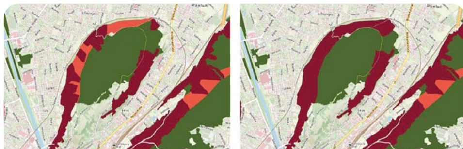
Abbildung 2: Das linke Bild zeigt einen Ausschnitt aus dem automatisiert erstellten Entwurf aus PROFUNmap (Legende siehe Abbildung 3). Nach dem Lokalaugenschein vor Ort und der Feststellung neuer Objekte wurden Objektschutzflächen (dunkelrot) ergänzt und arrondiert (Bild rechts). Es mussten z. B. auch Eisenbahnwaldflächen nachbearbeitet werden, die zur Zeit der Erstellung des digitalen GRAVIMOD-Infrastrukturlayers forstrechtlich noch nicht Wald und als Betriebsflächen (Objekte) im Kataster waren.

Die GRAVIMOD-DAKUMO-Daten decken die indirekte Objektschutzfunktion des Waldes nicht ab. Die indirekte Objektschutzfunktion aus dem Klassifikationskonzept von Perzl und Huber (2014) ist forstrechtlich im § 27 Abs 1 ForstG 1975 idGF angelegt, da eine "direkte Abwehr von Gefahren" zwangsläufig auf eine indirekte verweist (Perzl et al., 2019). Der Begriff bezieht sich auf Gefahrentypen und Wirkungsmechanismen, bei denen kein eindeutiger Zusammenhang zwischen dem Schadenspotenzial an einem bestimmten Objekt und den Flächen besteht, auf denen der Prozess ausgelöst und zum Objekt weitergeleitet wird. Wenn z. B. eine Rutschung am Hang hinter einem Haus anbricht und die Hangmure auf das Haus zufließt, lässt sich dieser Hangabschnitt als Fläche definieren, auf denen der Wald eine Objektschutzfunktion für dieses Haus haben sollte. Wird aber Rutschungsmaterial vom Grabeneinhang zuerst im Bach deponiert, ist der Prozess indirekt schadensrelevant. Es besteht kein eindeutiger kausaler Zusammenhang zwischen dieser Rutschung und dem Schadenspotential der Gerinnemure an einem bestimmten Haus auf dem Murkegel. Die