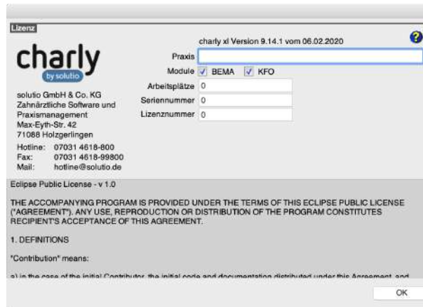
Abbildung 1 ► Lizenzfenster