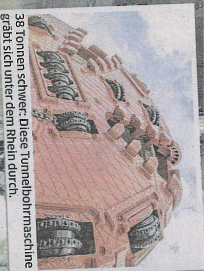
38 Tonnen schwer: Diese Tunnelbohrmaschine gräbt sich unter dem Rhein durch.