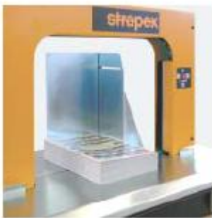
Paketanschlag Zum Ausrichten von losen Bündeln