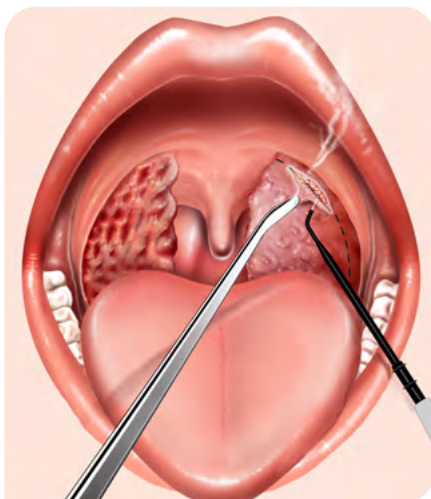
Abb. 2: Der hervorstehende Teil der Tonsille wird entlang der Inzisionslinie, parallel zum vorderen Gaumenbogen, abgetrennt. Die Tonsille wird dabei ohne oder mit nur leichtem Zug gefasst.