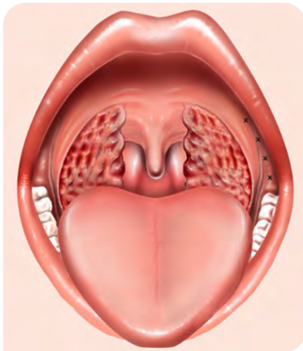
Abb. 1: Einstichstellen für die Infiltration mit Lokalanästhetikum.