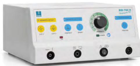
BM-780 II Radiofrequenz-Generator Basisset