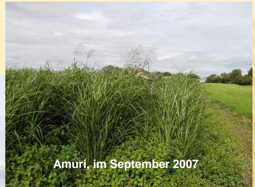
Amuri, im September 2007