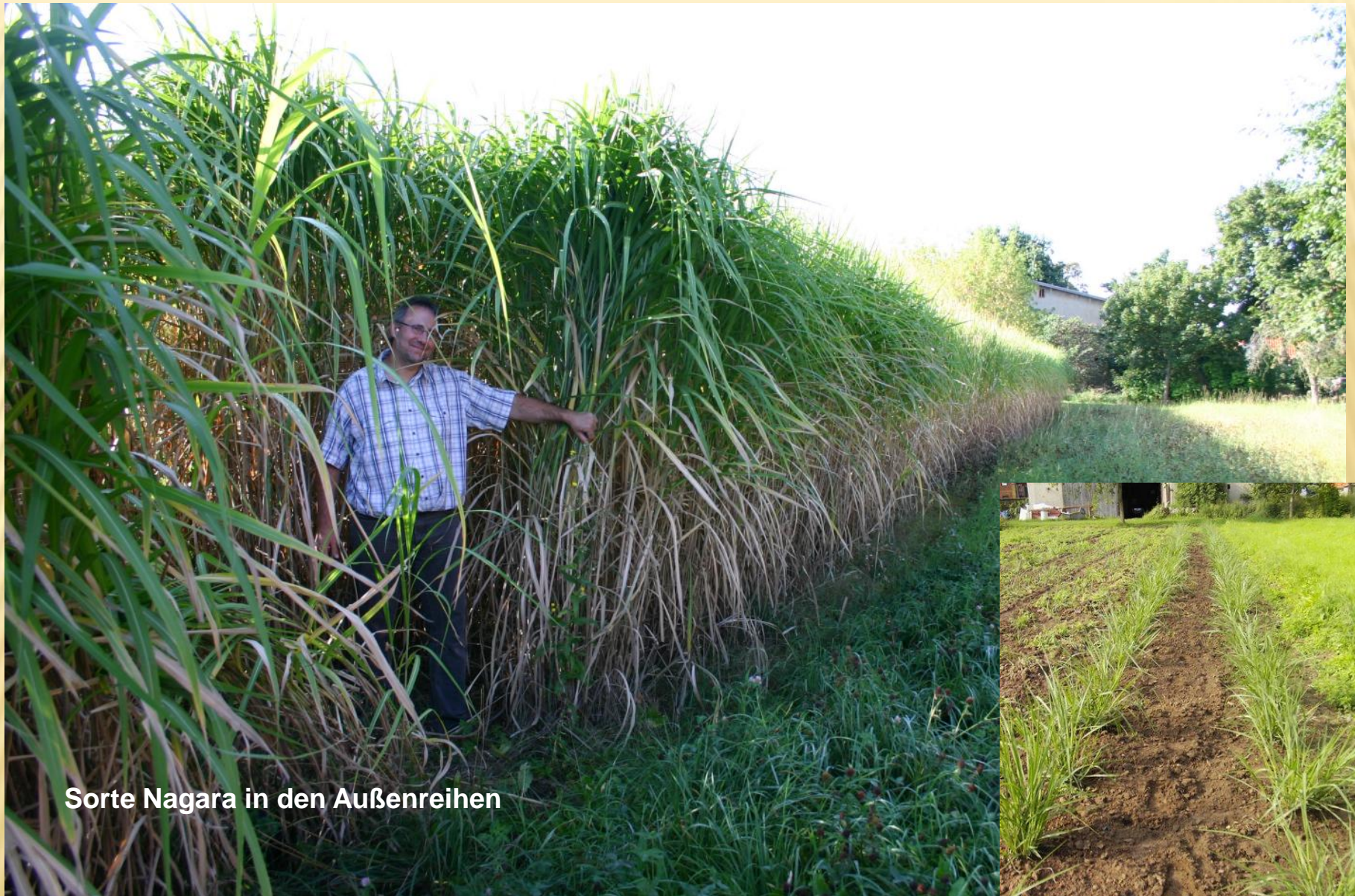
Sorte Nagara in den Außenreihen