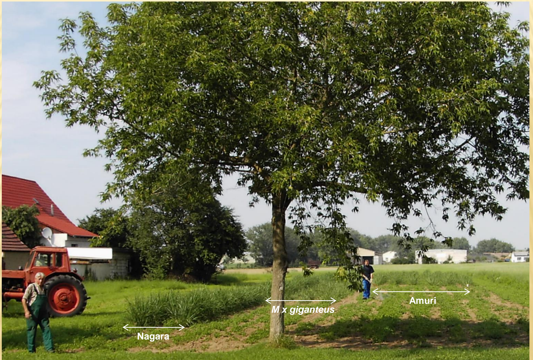
Miscanthusfläche in Ditfurt, Aufnahme vom 22.07.07