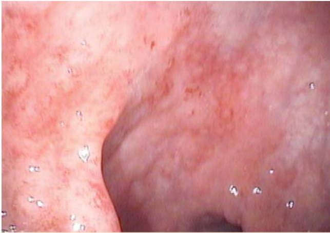
Abb. 1 Proktitis bei flex. Endoskopie.