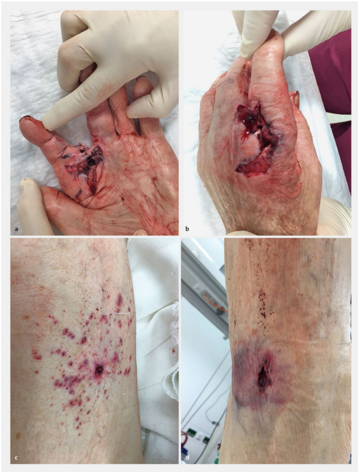
► Abb. 2 Schussverletzung durch eine Pistole mit Munition aus dem 2. Weltkrieg. a Einschuss an der linken Hand. b Ausschuss an der linken Hand. c Wiedereintritt des Projektils am linken Oberschenkel mit Blutsprengeln aus der Handaustrittswunde der Hand um den Wiedereintritt herum. d Austrittswunde am linken Oberschenkel.