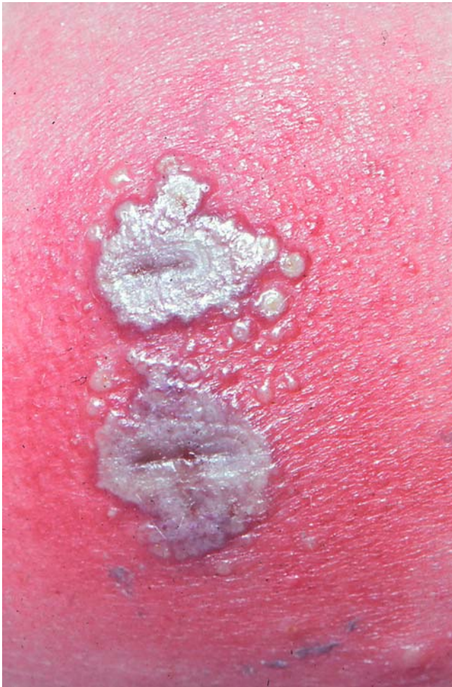
► Abb. 1 Variola inoculata mit starker pustulöser Reaktion auf Pockenimpfung mit Satellitenpusteln bei Neurodermitis atopica.