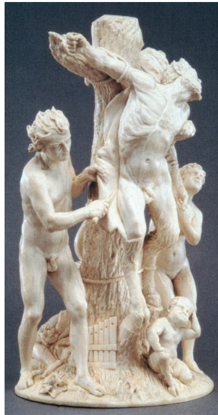
Abb. 2 Apoll schindet Marsyas. Adam Lenckhardt, Elfenbein 1644.

Es war in der frühen mythologischen Zeit, als griechische Götter Musikinstrumente erfanden, Apollon die Kithara (Leier) und Athena die Aulos (Oboe) genannte Doppelflöte. Das Blasen des Aulos entstelle ihr Gesicht, fand die eitle Athena, und verwarf ihr Instrument, nicht ohne die Verwünschung auszusprechen, wer immer