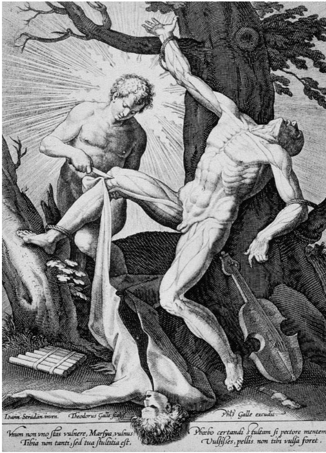
Abb. 1 Apoll schindet Marsyas. Kupferstich, gestochen von Theodor Gelle nach Entwurf von Jan van der Straet, gen. Stradanus, Florenz/Antwerpen um 1580 – 1600.

eine würdige, edle Art des Vollzuges einer Todesstrafe, wie auch der Selbsttötung.