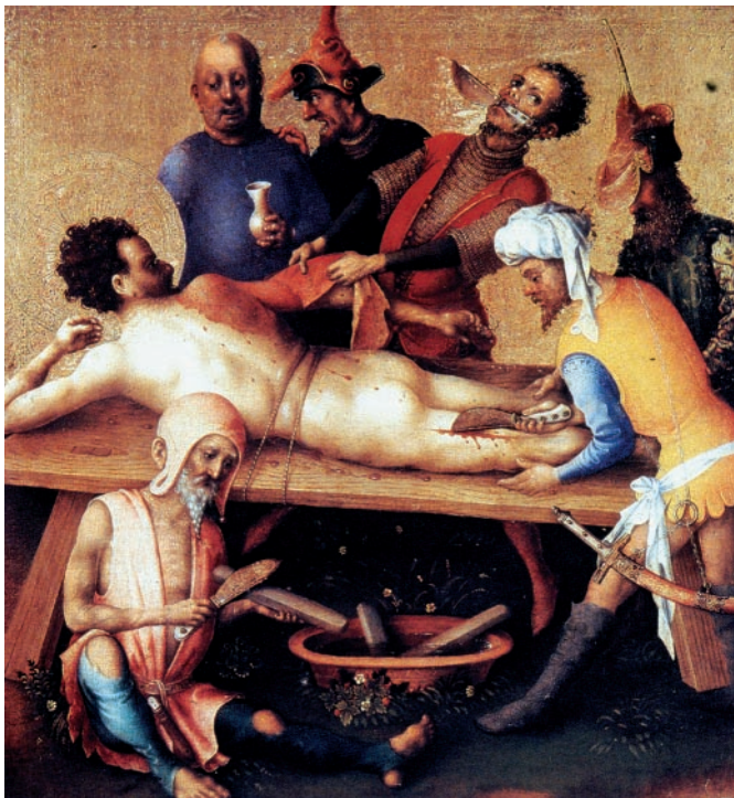
Abb. 4 Das Martyrium des hl. Bartholomäus von Stefan Lochner, Holz.