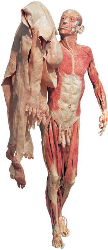
Abb. 7 Skinman, Ganzkörper-Plastinat von Gunther van Hagens, Institut für Plastination, Heidelberg, Ausstellung „Körperwelten“ ( www.koerperwelten.com )

Das Wort taucht beim legendären Räuberhauptmann „Schinderhannes“ wieder auf. Er fing als Johann Bückler (1777–1803) zunächst als Scharfrichter-Gehilfe an und trieb mit einer Bande sein Unwesen im Hunsrück und im Taunus, bis er endlich gefangen und hingerichtet wurde, allerdings nicht durch Schinden.