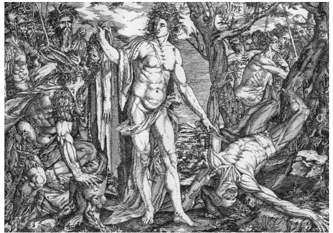
Abb. 3 Apoll schindet Marsyas. Meister M. F. 1536 (Monogrammist).

sie aufhöbe möge schwer bestraft werden. Der phrygische Satyr Marsyas fand die Flöte, hob diese trotz der Warnung auf, gelangte auf ihr zur Meisterschaft und forderte den Kithara spielenden Gott Apollon zum musikalischen Wettstreit. Der Sieger dürfe mit dem Besiegten verfahren wie ihm beliebt. Auf „Hautabziehen“ bei lebendigem Leibe, hatte man sich schon vorher geeinigt. Damals kam Wettkampf vor konzertantem Zusammenspiel. Es kam wie es kommen musste. Der Gott besiegte den Vermessenen und strafte ihn fürchterlich. Er hängte ihn an einen Baum und zog ihm bei lebendigem Leib die ganze Haut ab. „Was willst Du mich selber mir abziehen? Oh! Ich bereue!“ schrie der verzweifelte Satyr, „es gilt mir die Flöte nicht so viel!“. Während er schrie, wurde ihm die Haut über die Glieder gerissen, und er war nur eine Wunde, heißt es weiter bei Ovid. Die Geschichte von Marsyas galt seiner-