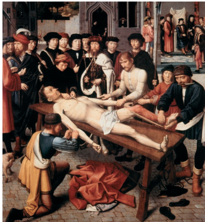
Abb. 6 Die Häutung des korrupten Richters aus dem Zyklus Gerechtigkeit des Kambyses von Gerard David, Holz 1498.